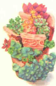
秘密花园 / 100