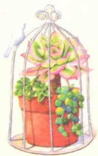
笼中世界 / 60