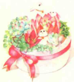
礼物 / 112