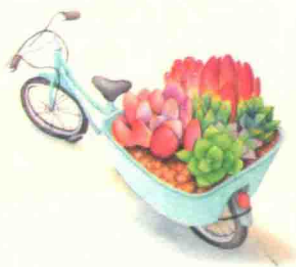
欢乐时光 / 88