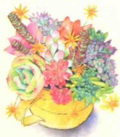
夏日烟火 / 79