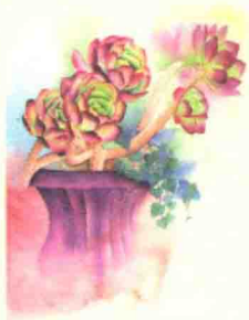
渴望 / 70