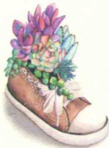
带你去远方 / 133