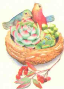
私语 / 123