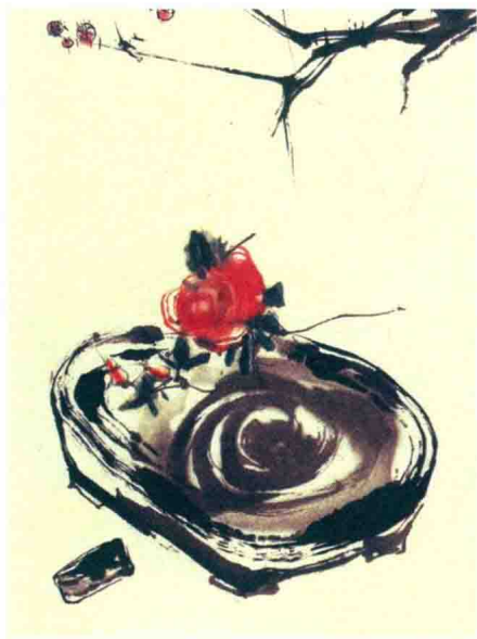
程十发 梅花欵砚图

以前人说：“若无花月美人，不愿生此世界。”我也说一句：“若无笔墨棋酒，不必定作人身。”