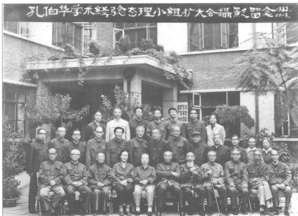
孔伯华学术经验整理小组