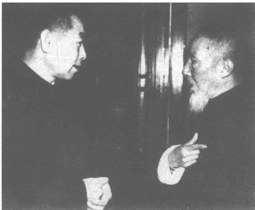
孔伯华与周恩来总理