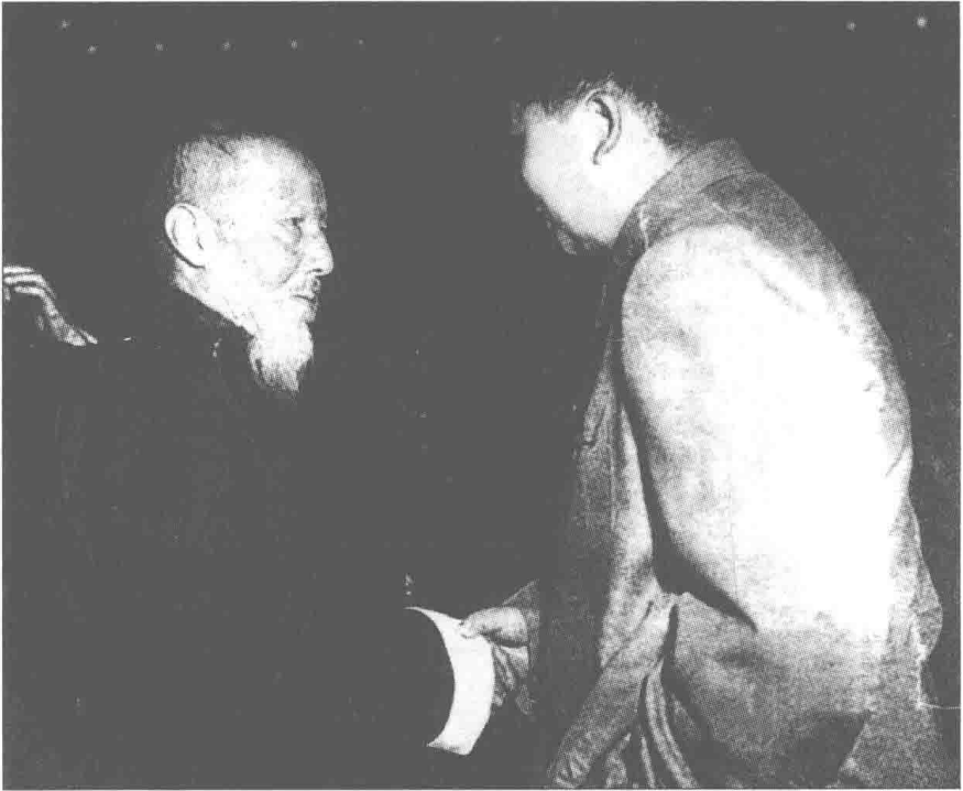
孔伯华与毛泽东主席