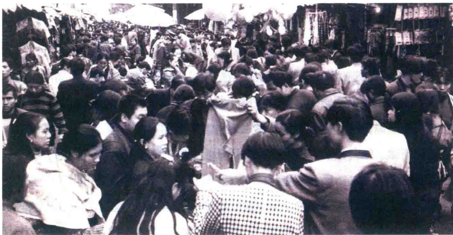
改革开放初期，贵阳市小商品市场的繁荣景象

随着农村改革的率先突破，贵州开始进行城市经济体制改革的探索。1979年，在调整、整顿的基础上，贵州加大了国营企业的改革力度，推行经济责任制，同时进行城市综合改革和其他方面配套改革。国企改革首先从工业企业开始，逐步拓展到商业、供销、粮食等流通企业。改革的主要内容是扩大企业自主权，增强企业活力。通过扩大企业自主权和推行责任制等措施，调动了企业生产经营积极性。在城市综合改革方面，从1980年起，贵州逐步放开了蔬菜、水果、肉食、日用小商品市场，下放了一部分企业管理权，还依托中心城市推动一些企业改组联合。改革综合经济部门管理体制，下放计划管理权限，改革财政管