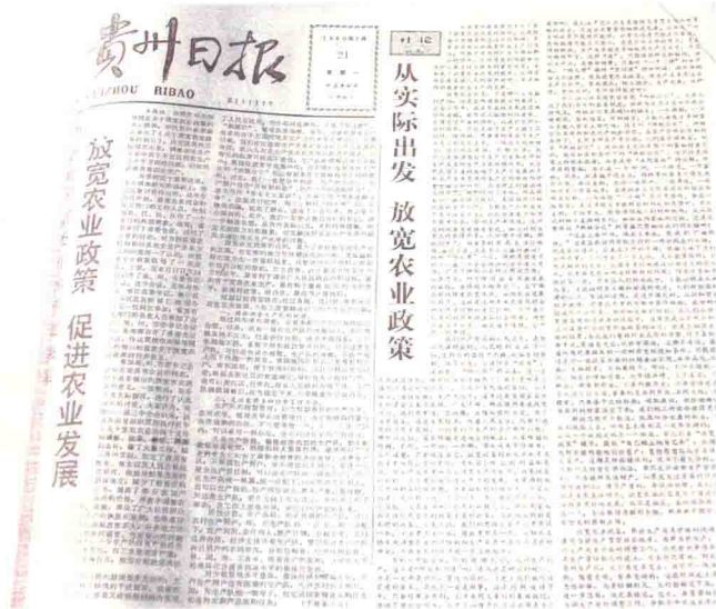
1980年7月15日，中共贵州省委发出了《关于放宽农业政策的指示》（38号文件）。图为《贵州日报》关于放宽农业政策的报道

改革开放之初，贵州省的农村改革实现较大的突破，走在全国前列。1978年3月，以关岭县顶云公社实行的定产到组生产责任制为发端，包干到户、包产到户等生产责任制逐渐扩大到全省。1980年7月，中共贵州省委发出《关于放宽农业政策的指