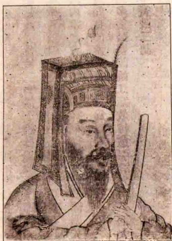
浙江圖書館藏民國七年鉛印本之王陽明公像