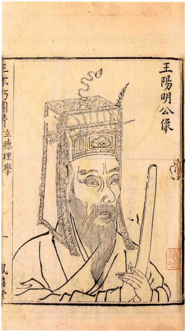
温州圖書館藏余烜刻本之王陽明公像