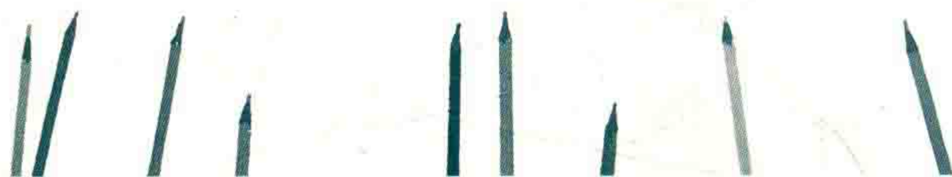
《纸花和黑色墨水》，1971年