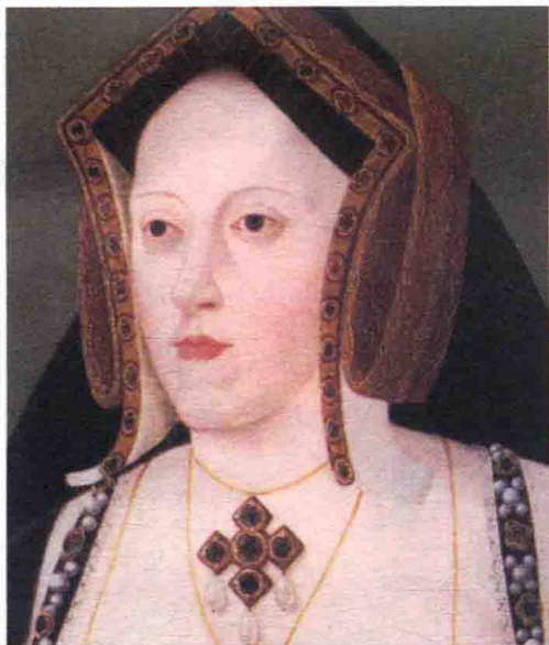
◆ 亨利七世短命的长子亚瑟及儿媳妇凯瑟琳

舅子亨利八世。可惜，长期远离西欧文明中心的苏格兰军队已经无法跟上战争进化的脚步，兵力略胜于对手的苏格兰军队最终兵败诺森伯兰郡的弗洛登平原，包括詹姆斯四世在内的上万苏格兰人血洒疆场，而英格兰方面仅仅损失了1000人。