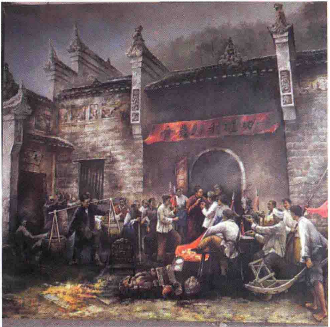
毛泽东考察湖南农民运动