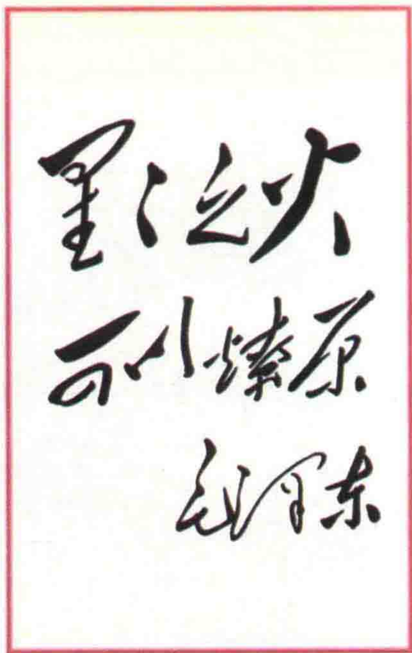
毛泽东：星星之火 可以燎原