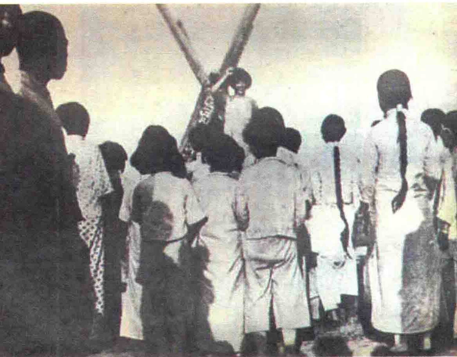
女学生在农村向民众宣传抗日道理

• 1936年1月2日，“平津南下扩大宣传团”分别从北平、天津出发，沿平汉路南下，到农村扩大抗日宣传。1月下旬，宣传团在保定等地被军警包围，被迫返回北平和天津。