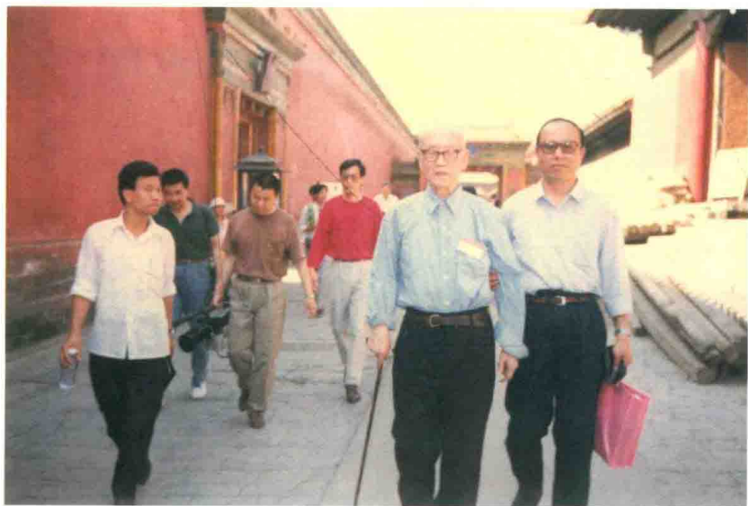
本书作者陪同金景芳先生游览故宫博物院(1992年)