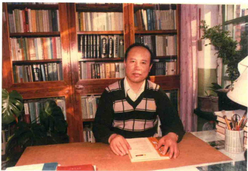
本书作者在书房中