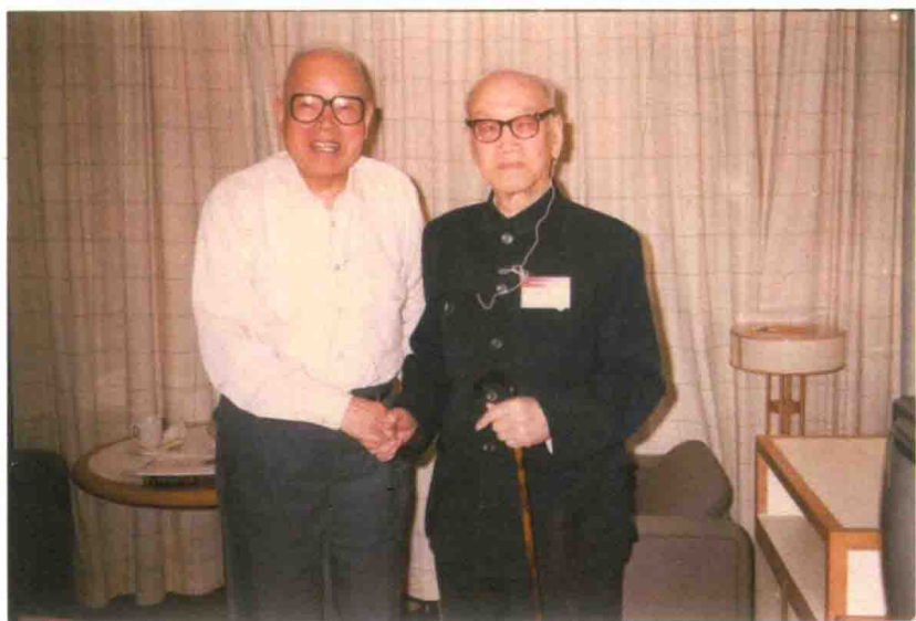
金景芳先生和甲骨学专家胡厚宣先生