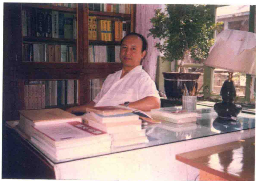
本书作者在书房中