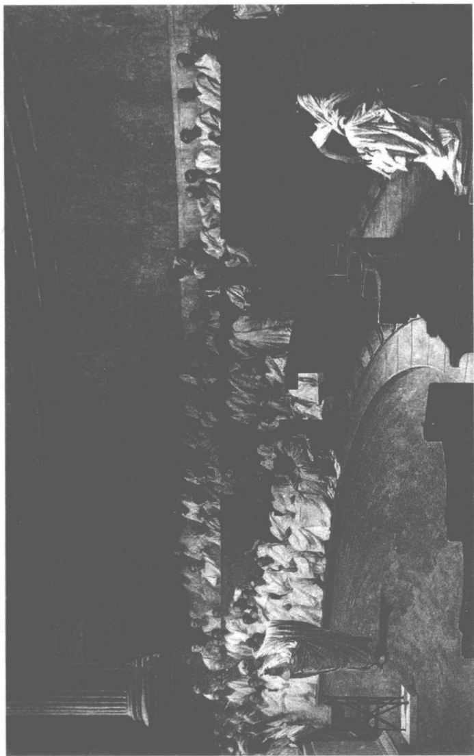
罗马帝国的元老院由各家族首脑组成，倡导言论自由。切萨雷·马卡里绘于1889年