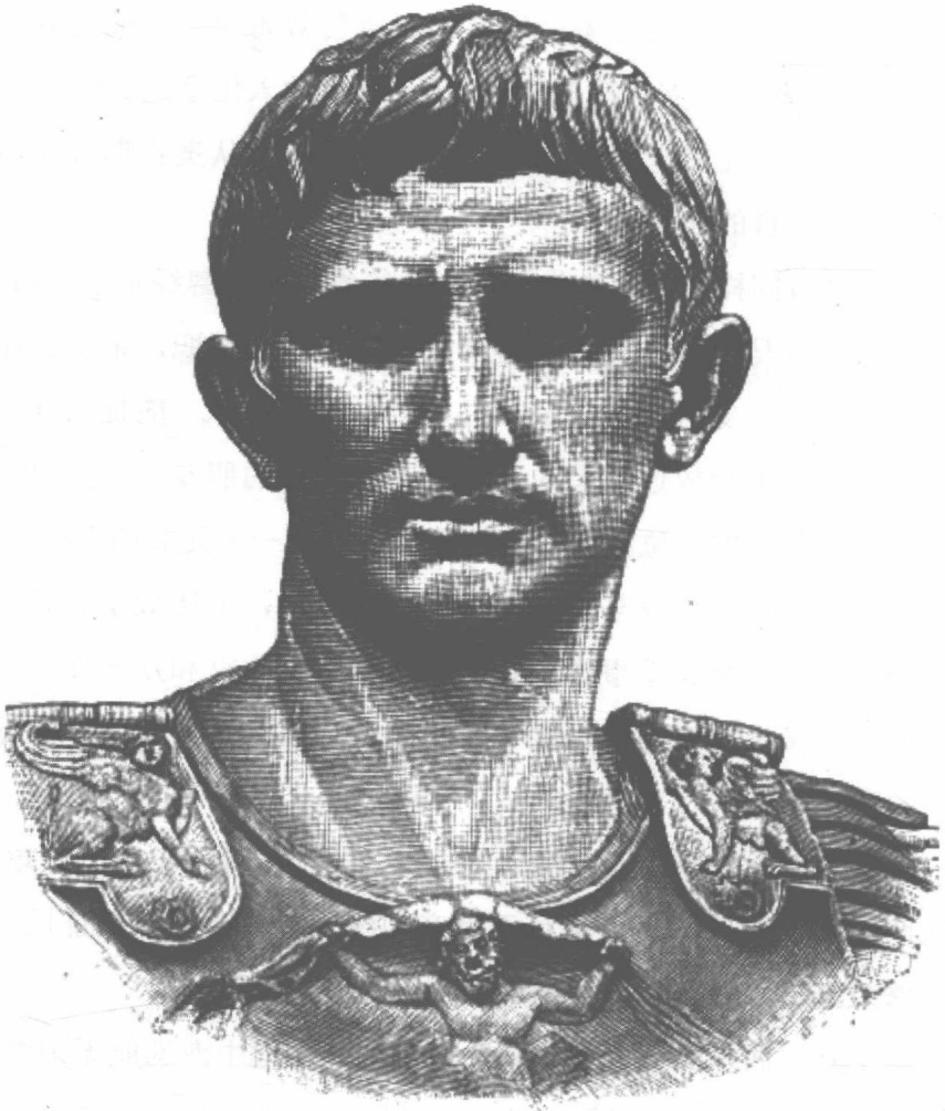
罗马帝国开国之君奥古斯都