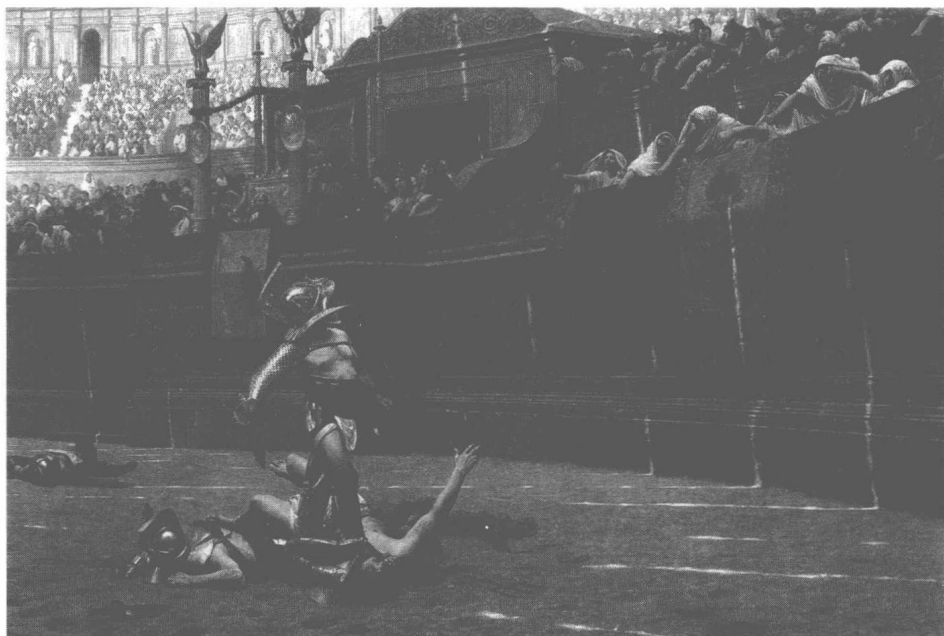
罗马有着名的罗马竞技场，它目睹了无数角斗士的搏斗与死亡。让·里奥·杰罗姆绘于1872年

罗马帝国的第一任皇帝奥古斯都，宣称他接收的罗马是一座砖城，但他留下的却是一座大理石城。后世之君就像奥古斯都一样热爱建筑。罗马帝国的遗迹至今依然随处可寻——大排水沟、广场、公共浴场、庄严的柱廊……罗马有着名的罗马竞技场，它目睹了无数角斗士的搏斗与死亡；其他地方如法国南部城市尼姆的小型圆形竞技场；西班牙塞戈维亚的排水沟；英格兰的浴场，还有一个小镇以该浴场命名；罗马帝国边界矗立的高墙。这些建筑工程无一不是出自天才设计师——奥古斯都之手。奥古斯都大胆规划，为了实现自己的理想，不惜耗费巨资和人力。