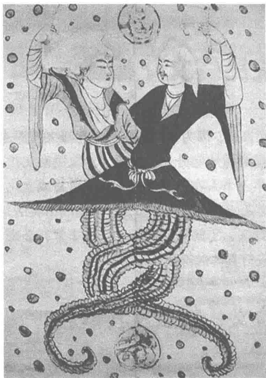
图 1-1-1 伏羲女娲交尾图

是一种行为规范。人类生命意义包含了两个方面的内容，一是生物学意义上的生命，另一是文化意义上的生命。如果说生物生命的基因是DNA，那么文化生命的基因就是哲学意义上的民俗。举个简单的例子来讲，中国民间四大传说之一的《白蛇传》想必我们耳熟能详，其中的“主要人物”白娘子是一条修炼成人形的蛇精，深受人们的喜爱。中国人从古至今对蛇就有一种敬畏之情，如图1-1-1所示，该图为伏羲女娲交尾图，能够充分地体现出古人对蛇的敬畏之情，人们把人面蛇神的伏羲与女娲称为中国人的“始祖”。