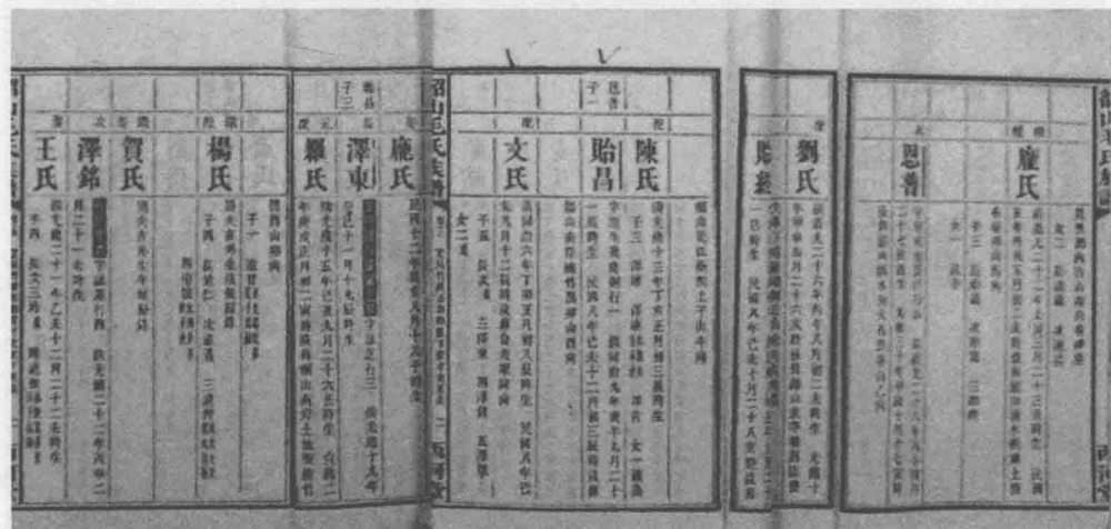
▲ 韶山毛氏族谱及有关毛泽东祖上三代的记载