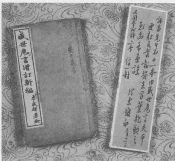
▲ 1915年，毛泽东给表兄文运昌归还的《盛世危言》和还书便条

激地议论了好几天。随着时间的推移，许多人对这件事逐渐淡忘了，毛泽东却久久不能平静下来。他觉得那些参加暴动的人都是善良的老百姓，只是被逼得走投无路才起来造反，结果却无辜被杀。这使他很痛心。几十年后，他感慨地说：这件事“影响了我的一生”。