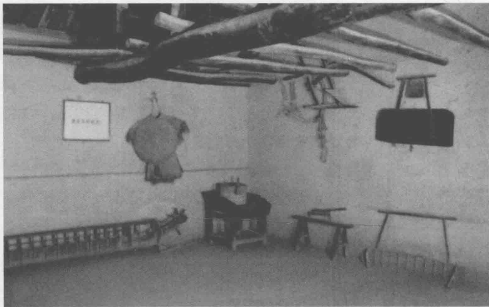
④ 毛泽东少年时参加劳动使用过的水车等农具

毛泽东在旧小说里关注的事情，在现实社会中也发生了。1910年4月，长沙发生了饥民暴动。起因是荒年粮价飞涨，有人率全家投塘自尽。饥民们涌到巡抚衙门请愿，反而遭到枪击，当场打死打伤多人。他们在忍无可忍的情况下，放火烧了巡抚衙门，捣毁了外国洋行、轮船公司、税关。清政府派兵镇压，暴动者的鲜血染红了浏阳门外的识字岭，被杀者的头颅高挂在南门外示众。毛泽东得此消息，同他人愤