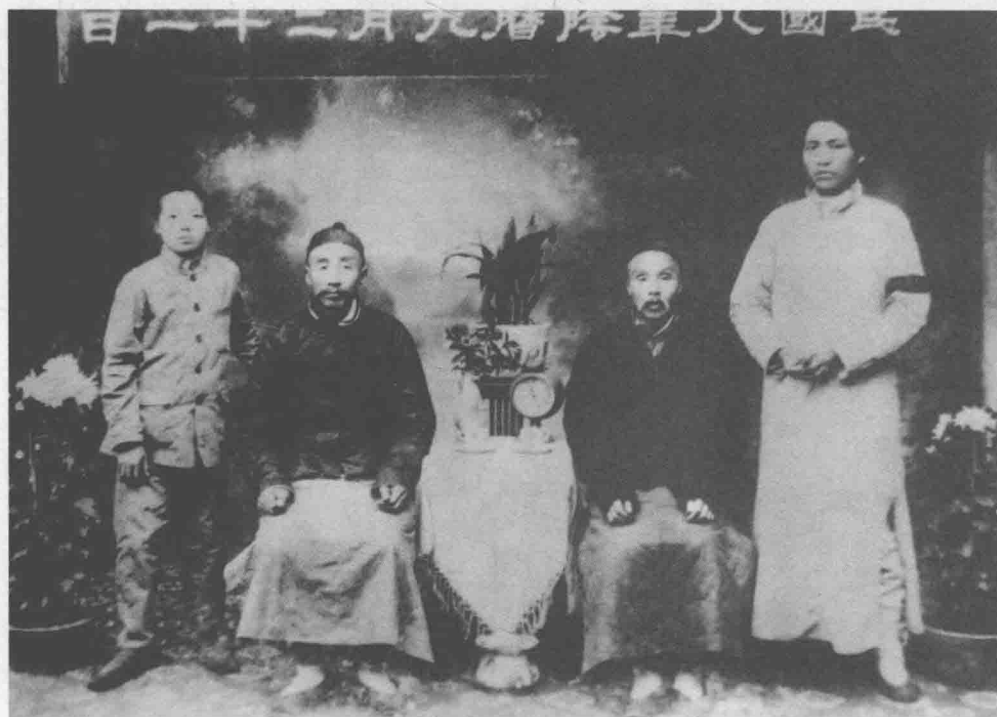
▲ 1919年10月，毛泽东同父亲毛顺生（左二）、伯父（左三）、弟弟毛泽覃（左一）在长沙合影

概对我也有好处，这使我干活非常勤快，使我仔细记账，免得他有把柄来批评我。”于是毛泽东养成了山区农家子弟的本色：吃苦耐劳，勤