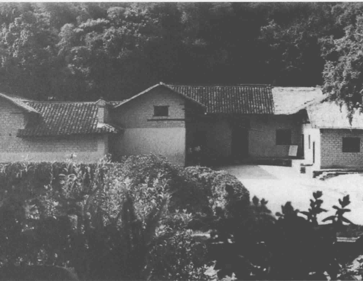
▲ 这是毛泽东诞生的地方，韶山故居

也积累一些银钱。还乡后，赎回毛恩普典出去的土地，不久又买进一些，增加到22亩。毛顺生善于经营，后来又做稻谷和猪、牛生意，资本逐渐滚到两三元，还自制了一种叫“毛义顺堂”的流通纸票。在小小的韶山冲，算是个财东了。