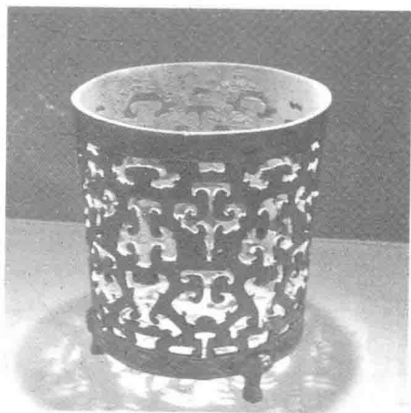
青铜炭火炉（荆州博物馆藏）

春秋战国时期的青铜器，如炭火炉，有镂空的造型，这足以说明在当时除了没有纸做原料外，在审美和制作上，已经具备了剪纸艺术产生的条件。先秦时期，诸种工艺水平趋于成熟，镂雕技术广泛流传，为剪纸艺术的产生奠定了造型基础。尽管当时纸没有出现，但在皮革、丝帛、银箔上刻剪的图案也可称为剪纸艺术的前身。