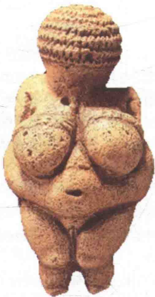
图1-1 威兰多夫的维纳斯

在欧洲各地出土的这些奥瑞纳文化(Aurignacian Culture)时期的裸体女性小雕像,基本上都是用质地较软的石灰石和泥灰岩雕成的。高度5厘米至10厘米不等,很少有超过15厘米者。著名的《威兰多夫的维纳斯》(图1-1)是从奥地利威兰多夫(Willendorf)出土的,肥大的乳房和突出的骨盆与阴部,把女性的特征夸张得无以复加,这可能与当时祈愿人类的繁衍有一定的关系。尤其是从那微呈弯曲的膝盖部分,可以看出制作者已对人体的结构有了一定的了解和表现能力。至奥瑞纳文化后期,这类裸体女性小雕像的风格更趋简练,甚至还有一些作了抽象的形体处理,但却并未妨碍性特征的强调(图1-2),这种类似咒术的意味,始终贯穿于旧石器时代工艺美术中。