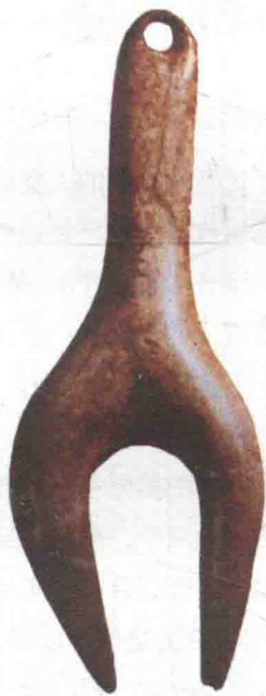
图1-2 维士多尼斯的抽象人像