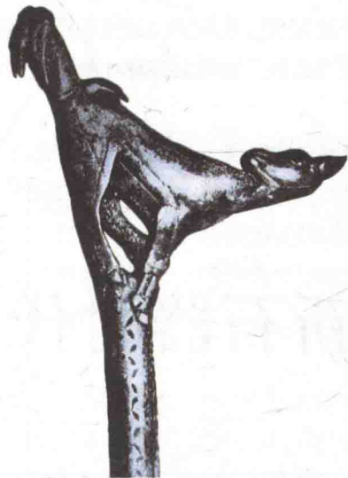
图1-4 有小羚羊雕饰的投枪器

原始狩猎民族为了延长投枪的射程和提高命中率而发明的辅助器——投枪器，大都为兽骨制成，其装饰十分精美。巴黎人类博物馆藏的《有小羚羊雕饰的投枪器》（图1-4）和《有斗狮雕饰的投枪器》都是用驯鹿骨做成的，位于器物一端的小羚羊和斗狮雕刻，形体生动，手法写实，显示了狩猎民族出色的装饰技艺。