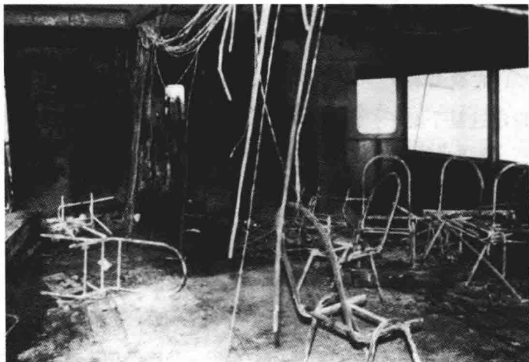
“海瑞号”底舱被烧概貌