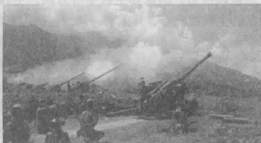
解放军“联合行动—2014E”实兵演习

4. 外交手段。国防外交活动主要是指国家与国家之间为了国防目的而开展的外交活动。由于这种外交主要涉及军事领域,所以又称军事外交。它既有通