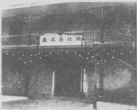
湖北兵工厂（湖北枪炮厂）

在国防工业建设方面：西方列强的坚船利炮终于使清王朝意识到加强近代国防工业建设的必要性和重要性。于是，在洋务派的大力推动下，清政府开始引进近代军事技术，建立近代的军事工业。后来，为了解决经费问题，又兴办了一些民用工商业。当时国防工业的产品主要是枪、炮、军火和轮船，规模较大、设备较好、产品较优的军工企业主要有江南制造局、福州船政局、金陵机器局、天津机器局和湖北枪炮厂，它们基本反映了中国近代军事工业的创建过程和发