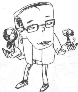
大学电子物理教师“我”和他的一对从火山石里蹦出来的小精灵——小参娃和小黑猴