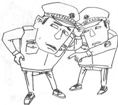
刑警队长路加和他的助手