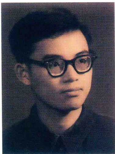
就读于中山大学 / 1960 年