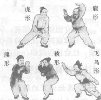
图 1-5 五禽戏

至隋唐五代,体育空前繁荣。体育项目呈现多样化和规范化的特点,许多运动项目明确了规格型制,拥有了专职机构和专业人员,如蹴鞠(见图1-6)、武术、角抵等;体育竞技状况空前兴盛,规模宏大,运动技艺水平有了很大提高;体育运动蔚然成风,有马球、蹴鞠、踏球、抛球等,其中以马球(见图1-7)和蹴鞠最为盛行;国际体育交流增多,一方面,唐代的技击术在朝鲜半岛的新罗广泛流行,养生术、蹴鞠也传入日本;另一方面,印度人、罗马人的杂技和幻术从汉代起就不断传入中国,自唐代日本倭刀也为中国武林所重视。