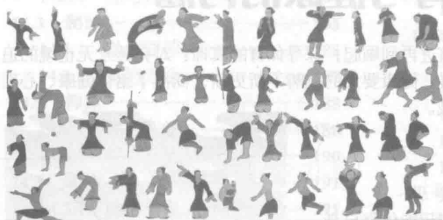
图 1-4 导引术

封建社会前期,从战国到南北朝,体育蓬勃发展。就种类而言,体育运动的项目不断增多,内容日益丰富,游戏、导引(见图1-4)等普遍开展,其中以华佗所创的五禽戏(见图1-5)最负盛名;就范围而言,从皇宫到民间,从军队到学校,从城市到乡村都有体育活动开展;就技术而言,角抵、蹴鞠等项目发展较快,逐渐向竞技方向靠拢,出现了不少技艺高超的体育人才;就理论而言,体育专著在这一时期也开始涌现。