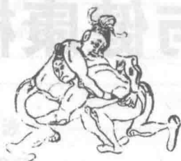
图 1-2 角力图

这一时期,频繁的军事战争成为体育演进的重要动力。有文字记载的体育运动包括射、御、角力(见图1-2)、兵器武艺、奔跑、跳跃、举鼎、拓关、游水、弄丸(见图1-3)、投壶、棋类活动等。