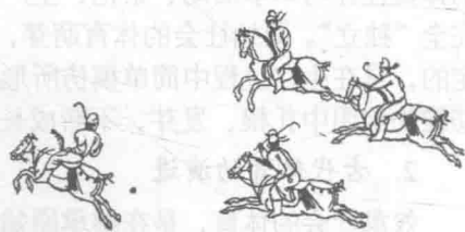
图 1-7 打马球图