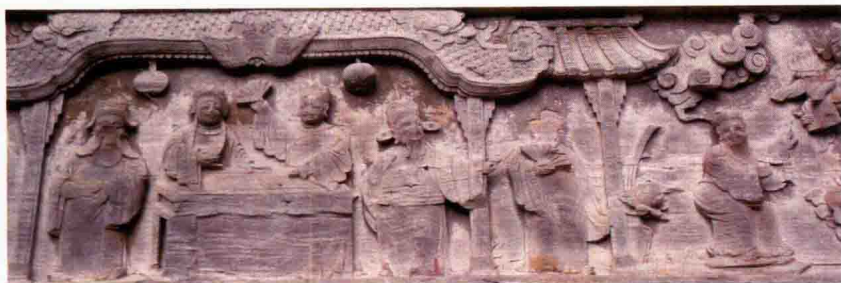
阳朔兴坪古戏台木雕