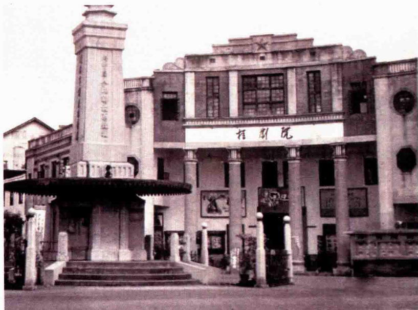
二十世纪六十年代的桂林桂剧院