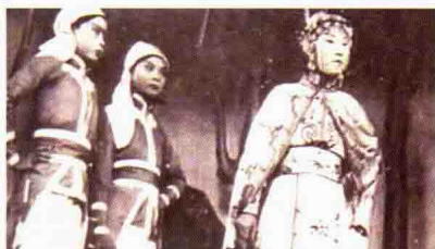
西南剧展中演出的桂剧 《梁红玉》剧照