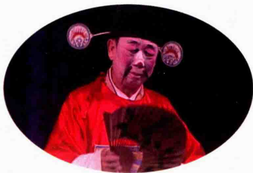
桂剧著名表演艺术家筱兰魁饰演的 《唐知县审诰命》