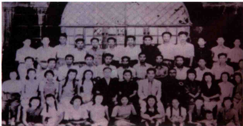
欧阳予倩 1946 年告别桂林时与广西艺术馆同仁合影