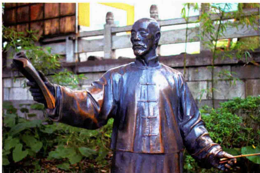
位于榕湖畔故居前的唐景崧塑像