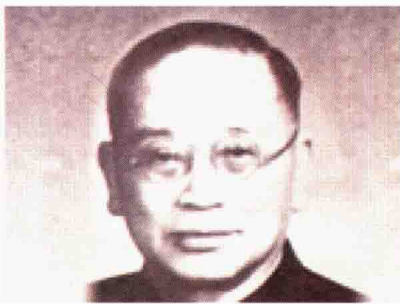
著名戏剧家欧阳予倩