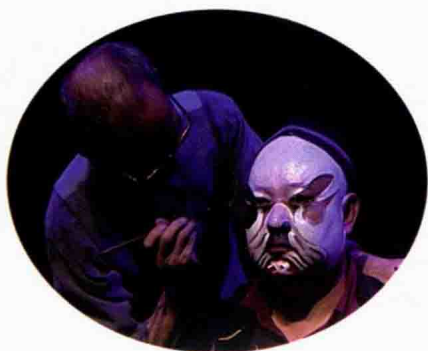
桂剧老艺人给净行演员化妆