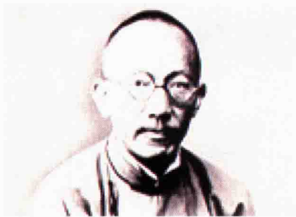
桂剧改革倡导者 著名教育家马君武