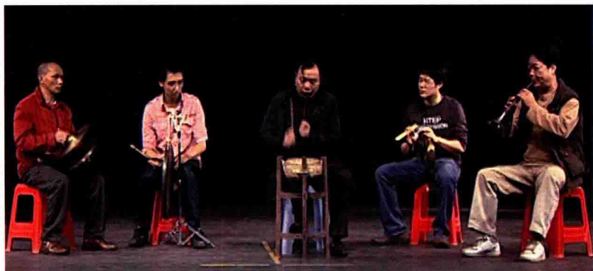
桂剧打击乐与唢呐