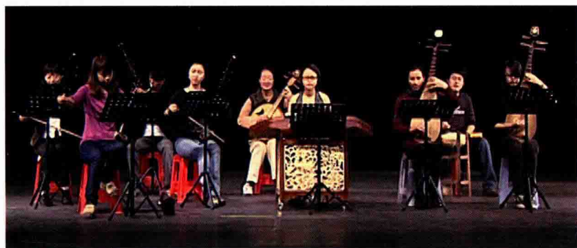
融入多种现代元素的桂剧管弦乐队