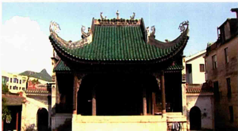
恭城湖南会馆古戏台