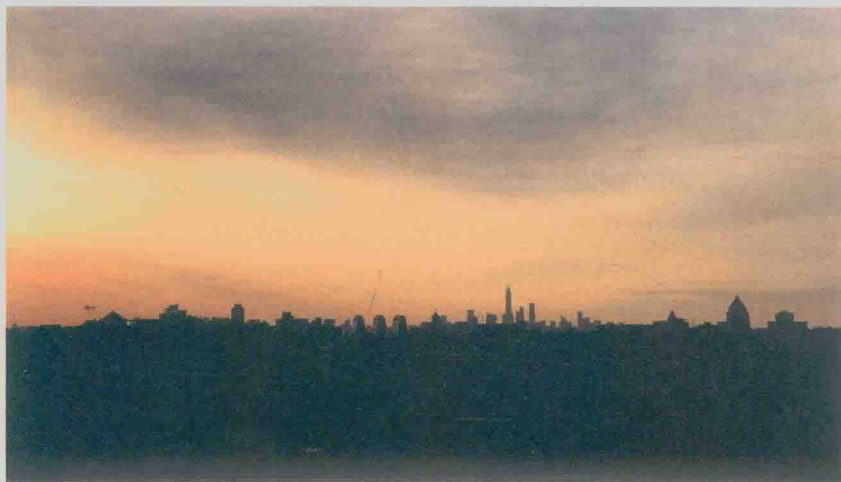
北京城：一座现代的城市（2017）