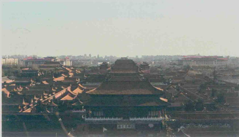
北京城：一座古老的城市（2017）