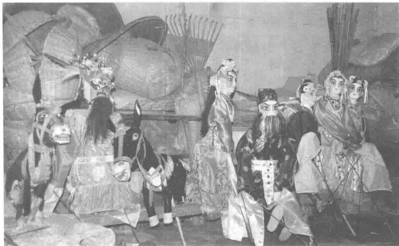
汝阳县南庄木偶

南庄木偶戏诞生于洛阳市汝阳县陶营镇南庄村,属于杖头木偶,当地老艺人又称其为肘偶(zhōu hōu)。逼真的人物造型、精美的服装道具、灵活的肢体动作,使