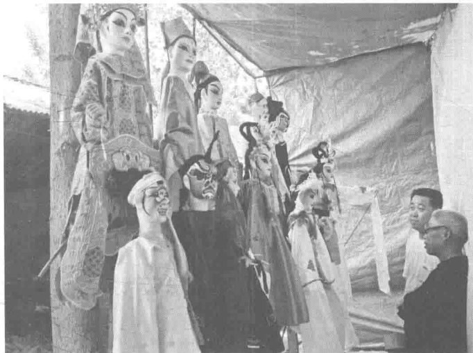
灵宝木偶人子

艺术团”,之后开始在周边地区演出。2008年,灵宝木偶戏被灵宝市人民政府确定为第一批市级非物质文化遗产保护项目。2009年,灵宝木偶戏被列入第二批河南省省级非物质文化遗产名录。