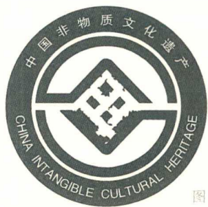
图1-1 中国非物质文化遗产标志

保护和利用好非物质文化遗产，对于继承和发扬民族优秀传统文化传统、增进民族自信心和凝聚力、实现经济社会的全面、协调、可持续发展具有重要意义。