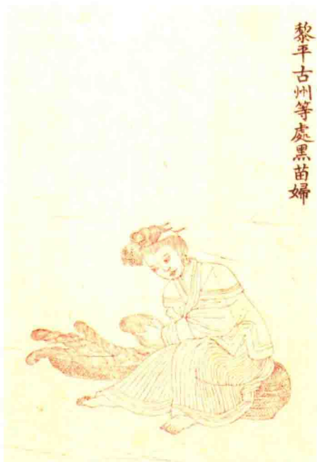
《皇清职贡图》中的黑苗服饰

黔东南州面积30 339平方千米，位于贵州省东南部，东临湖南省怀化市，南接广西柳州市、河池市，西连黔南州，北抵遵义市、铜仁地区。黔东南州总体地势是北、西、南三面高而东部低，中部雷公山区和南部月亮山为中山地带，西部和西北