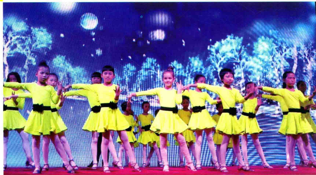
伦巴启蒙《蝴蝶》剧照