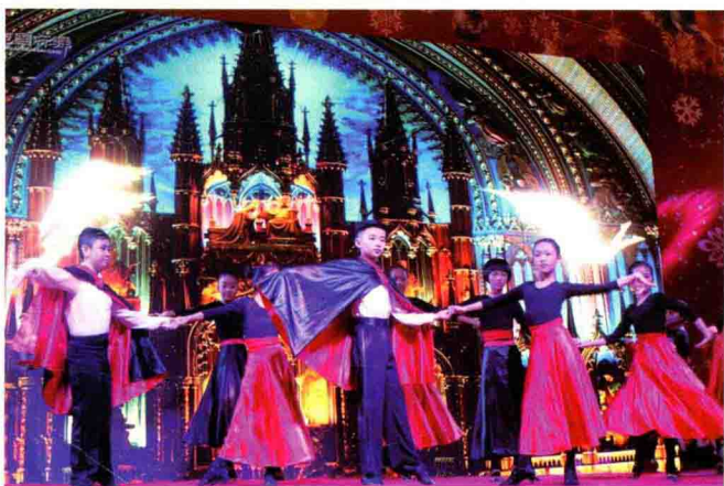
《弗拉门戈之夜》剧照