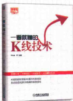
一看就懂的K线技术