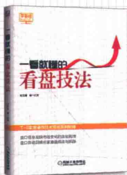
一看就懂的看盘技法