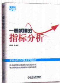
一看就懂的指标分析