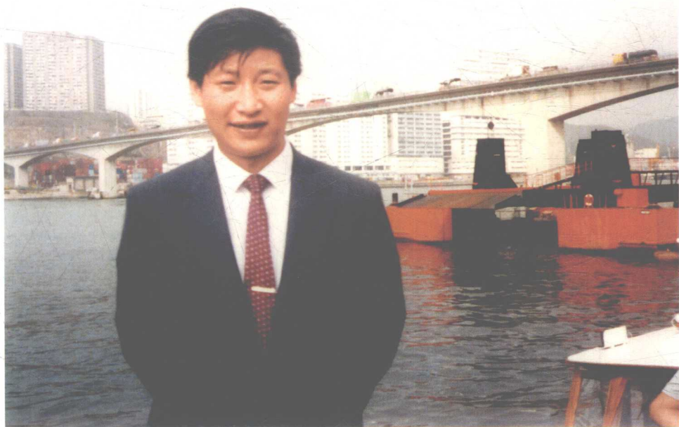
時任福建省廈門市副市長的習近平到國外考察