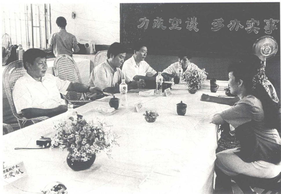
一九九三年八月，時任福建省福州市委書記的習近平在福州市、臺江區 領導聯合接待羣衆日接待羣衆。