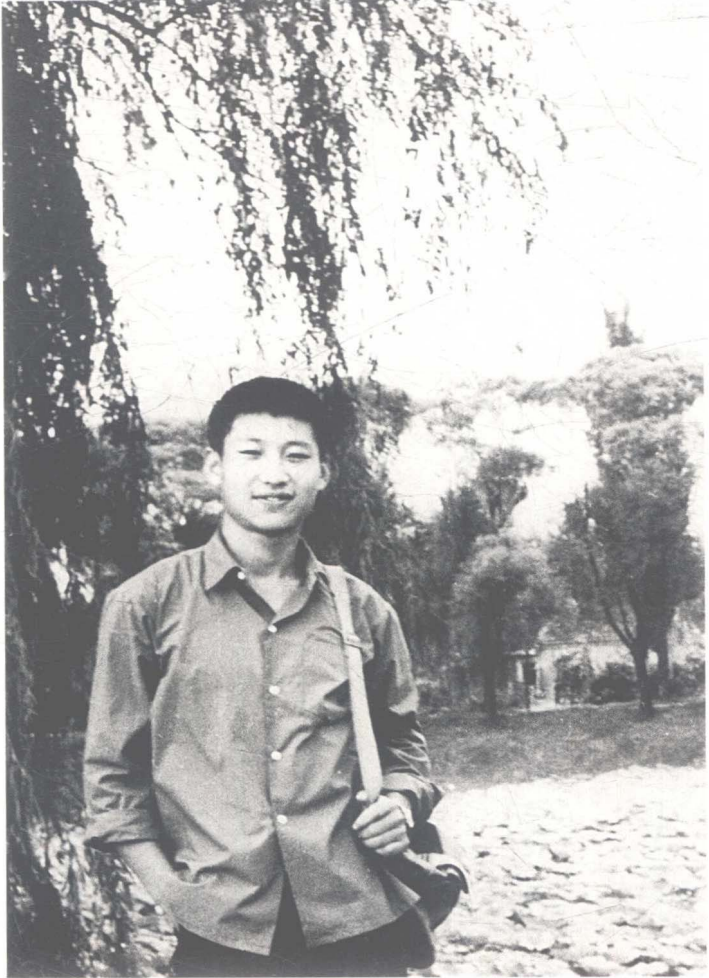
一九七二年，插隊回京探親時的習近平。