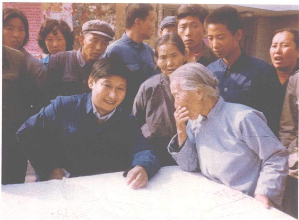
一九八三年，時任河北省正定縣委書記的習近平臨時在大街上擺桌子聽取老百姓意見。