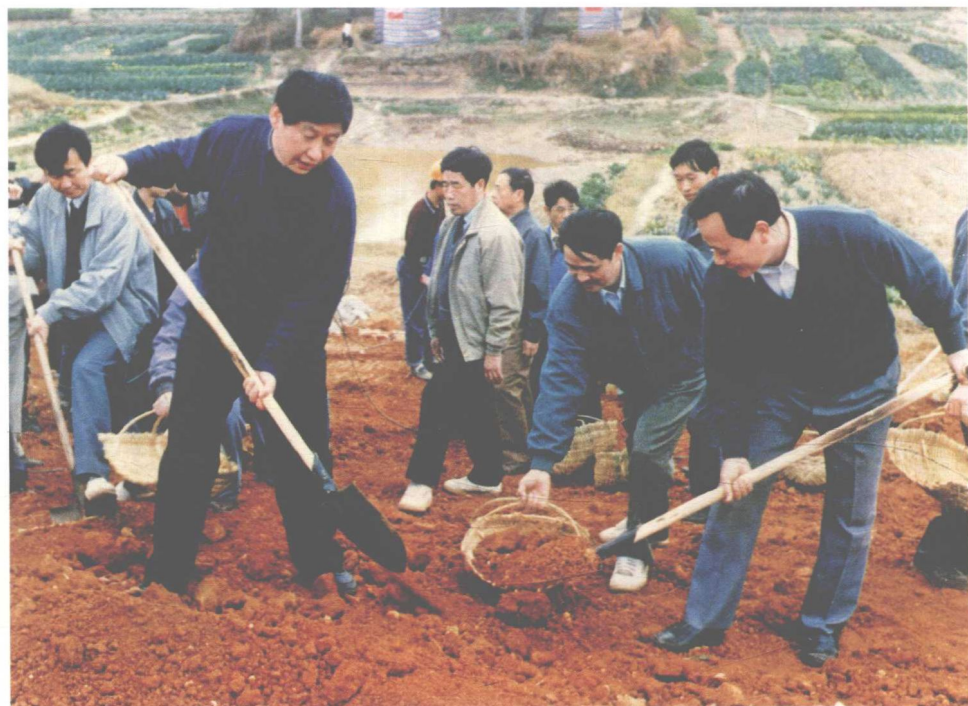
一九九五年十二月，時任福建省委副書記、福州市委書記的習近平在閩侯縣參加閩江下游防洪堤加固工程勞動。