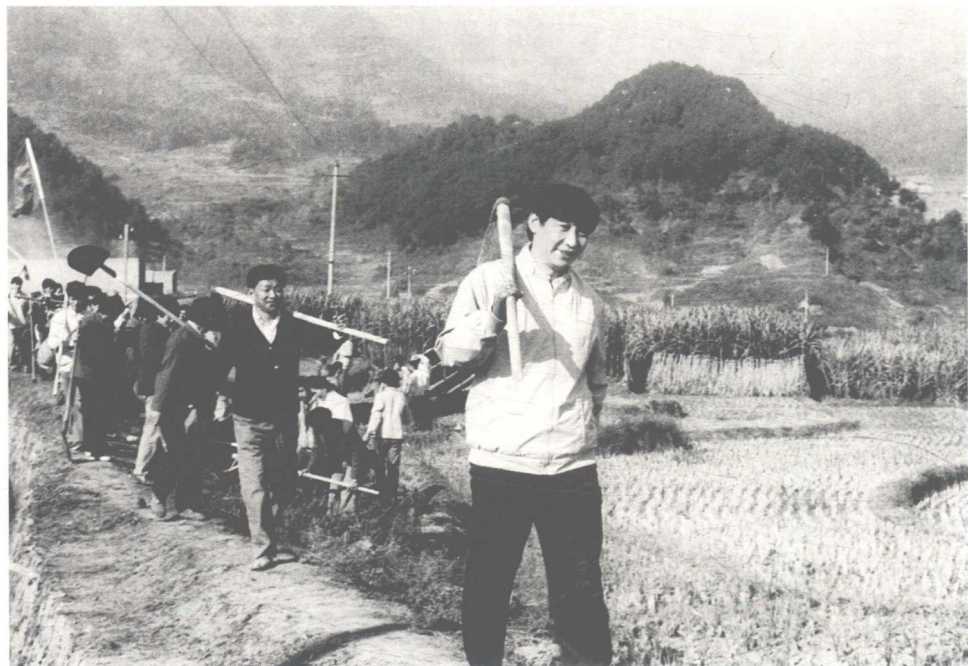
一九八九年，時任福建省寧德地委書記的習近平在農村參加勞動。