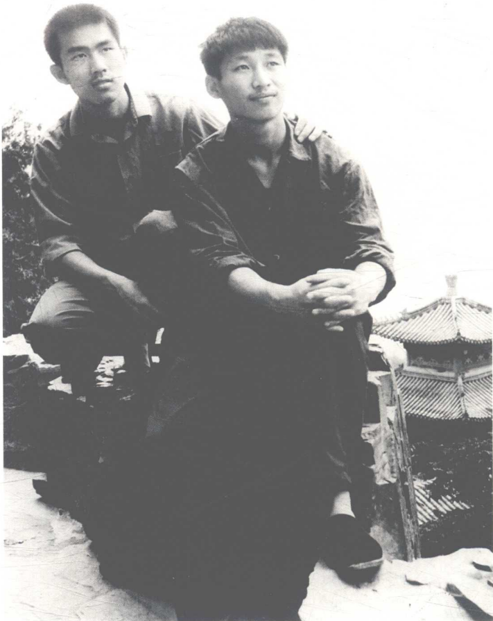
一九七七年，讀大學時的習近平。