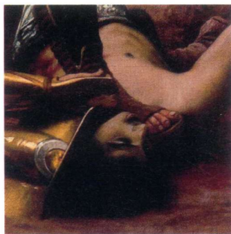
► B. 英俊的投网斗士