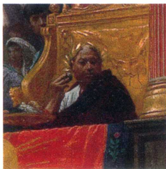
► D. 罗马皇帝

画家故意把他们脸上的表情刻画得扭曲而丑陋。在兴奋的人群当中，有两个老人（右侧观众席第二排）仿佛在祈祷似的双手交握，一动不动，沉痛的面色格外引人注目。