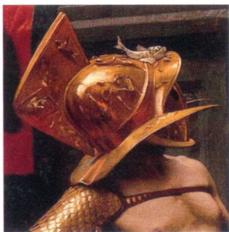
► A. 戴金色头盔的角斗士

在铺满沙子的场地上，战斗已经结束。头戴金色头盔的角斗士站到了最后，他正用一只脚踏住濒死的对手的喉颈，抬起头来。坐在最前排的所有身穿白色长袍的女人，和坐在她们身后的男人几乎全都做出倒竖拇指（thumbs down）的剧烈动作，齐声大喊“杀死他，杀死他”。这声音也传进胸部被刺伤倒地的败者的耳朵，他使出最后一丝力气，伸出右臂，仿佛在乞求观众大发慈悲。然而，看到鲜血染红沙地的观众无比兴奋，喊声一波高过一波。