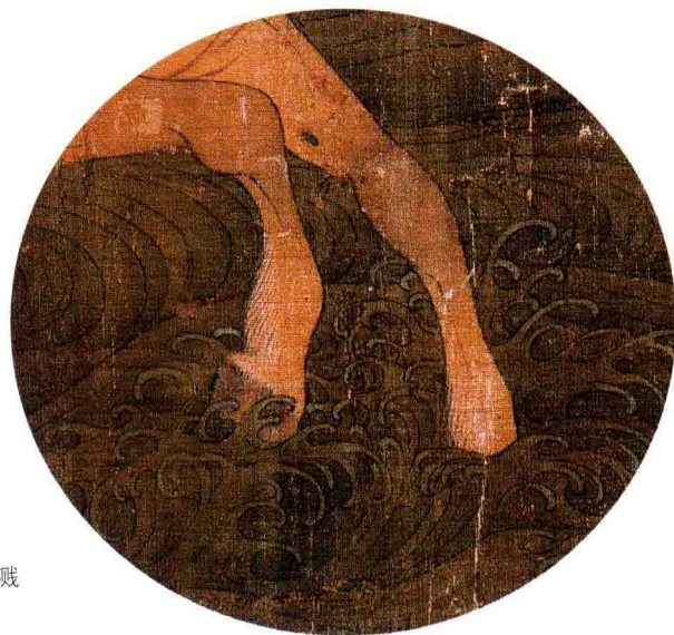
马蹄踏水，水花四溅