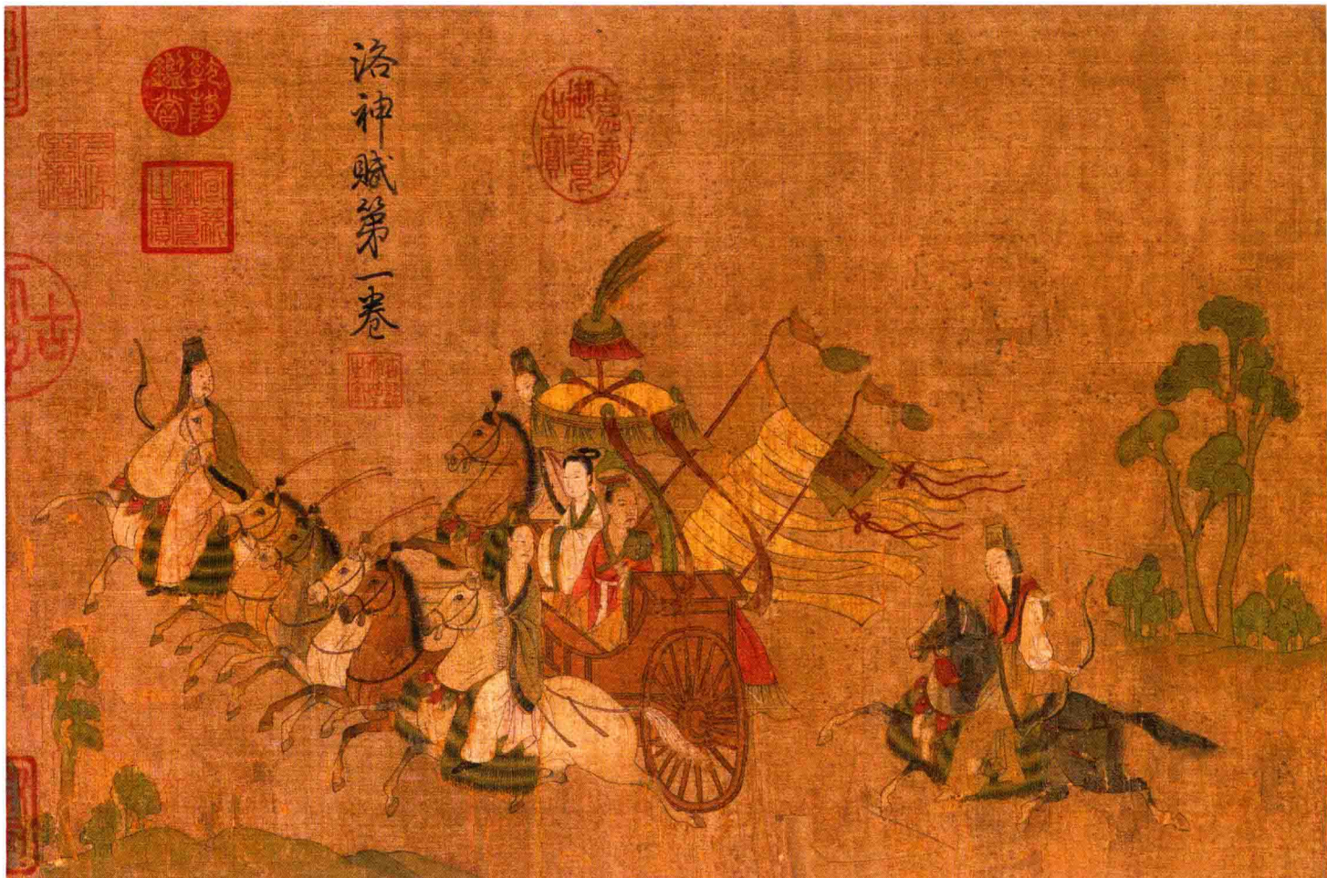
● 顾恺之《洛神赋图》摹本局部 东晋 约1600年前