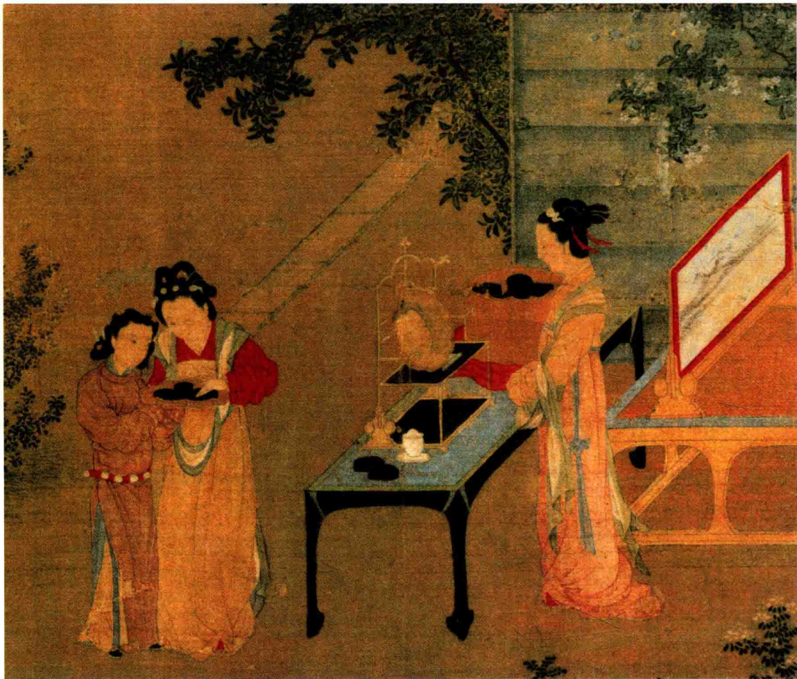
● 王诜《绣枕晓镜图》局部 北宋 约910年前