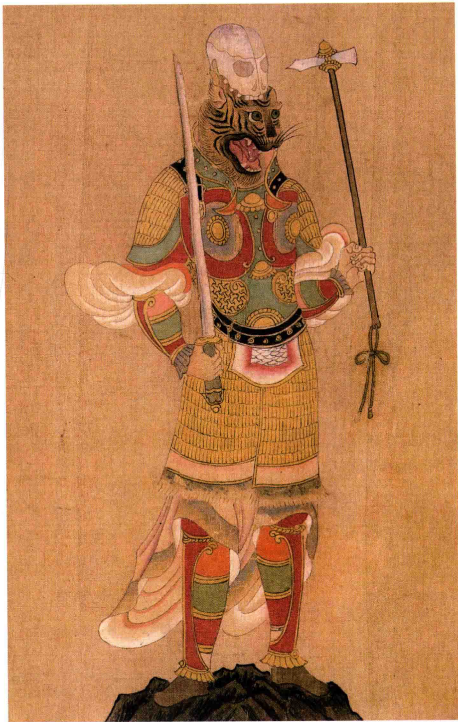
● 张僧繇（传）《五星二十八宿神形图》摹本局部 南北朝·梁 约1500年前

画面中这位是主管“危宿”的神仙，长着一颗老虎的头，还张着血盆大口。他一手持剑，一手握斧，身穿带黄色亮片的铠甲，好像正要投入一场凶险的战斗……“危宿”代表灾祸凶险，“危宿神”头上顶着骷髅，或许寓意着“一将功成万骨枯”吧！