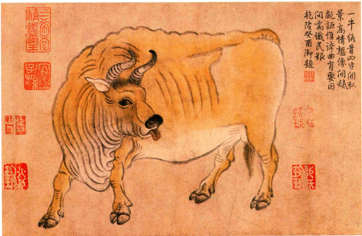
● 韩滉《五牛图》局部 唐代 约1200年前