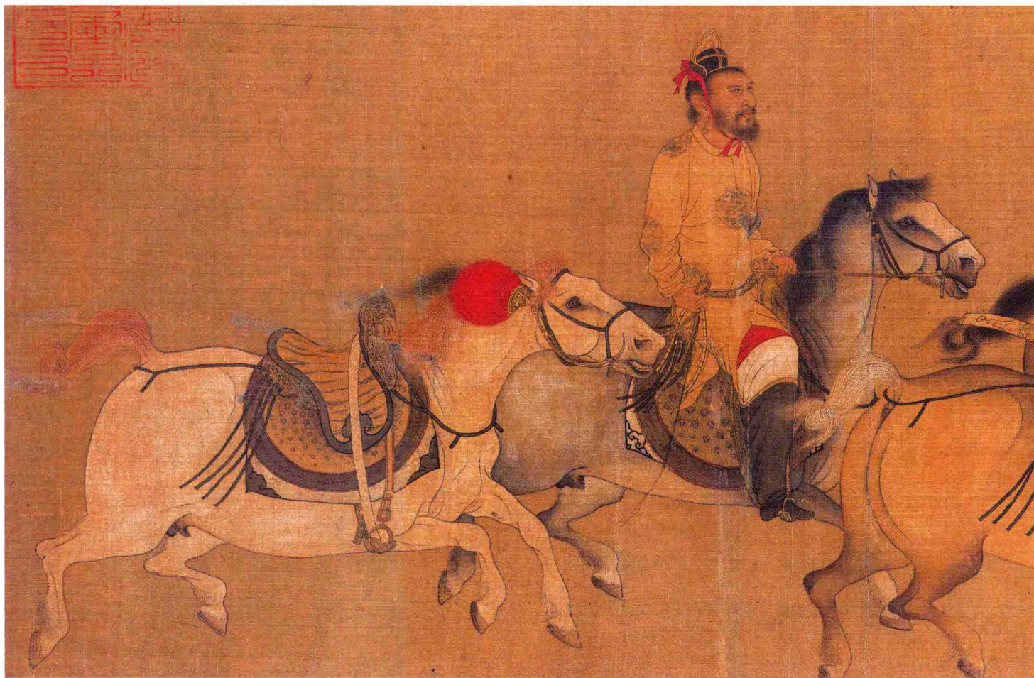
● 李赞华（传）《东丹王出行图》局部 五代十国·后唐 约1000年前