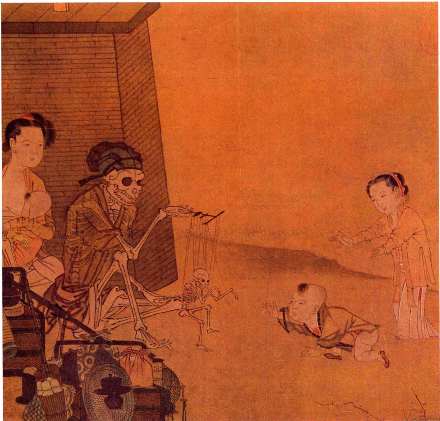
● 李嵩 《骷髏幻戏图》局部 南宋 约 750 年前