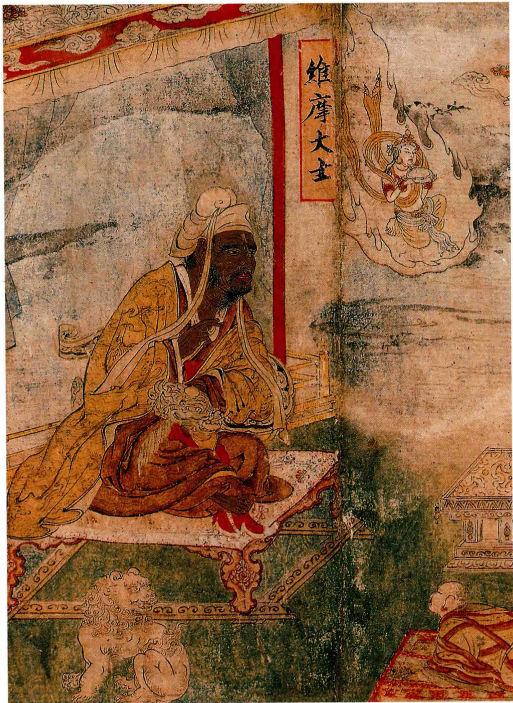
● 张胜温 《大理国梵像卷》局部 大理 约 810 年前

画中这位身披黄色长袍的就是“维摩大士”。“维摩”是梵文，“维”是“没有”的意思，“摩”是“脏”的意思，“维摩”就是“无垢”。传说他本是古印度的一个富翁，家财万贯，奴婢成群，但他虔诚修行，最终达到了不垢不净的解脱境界。