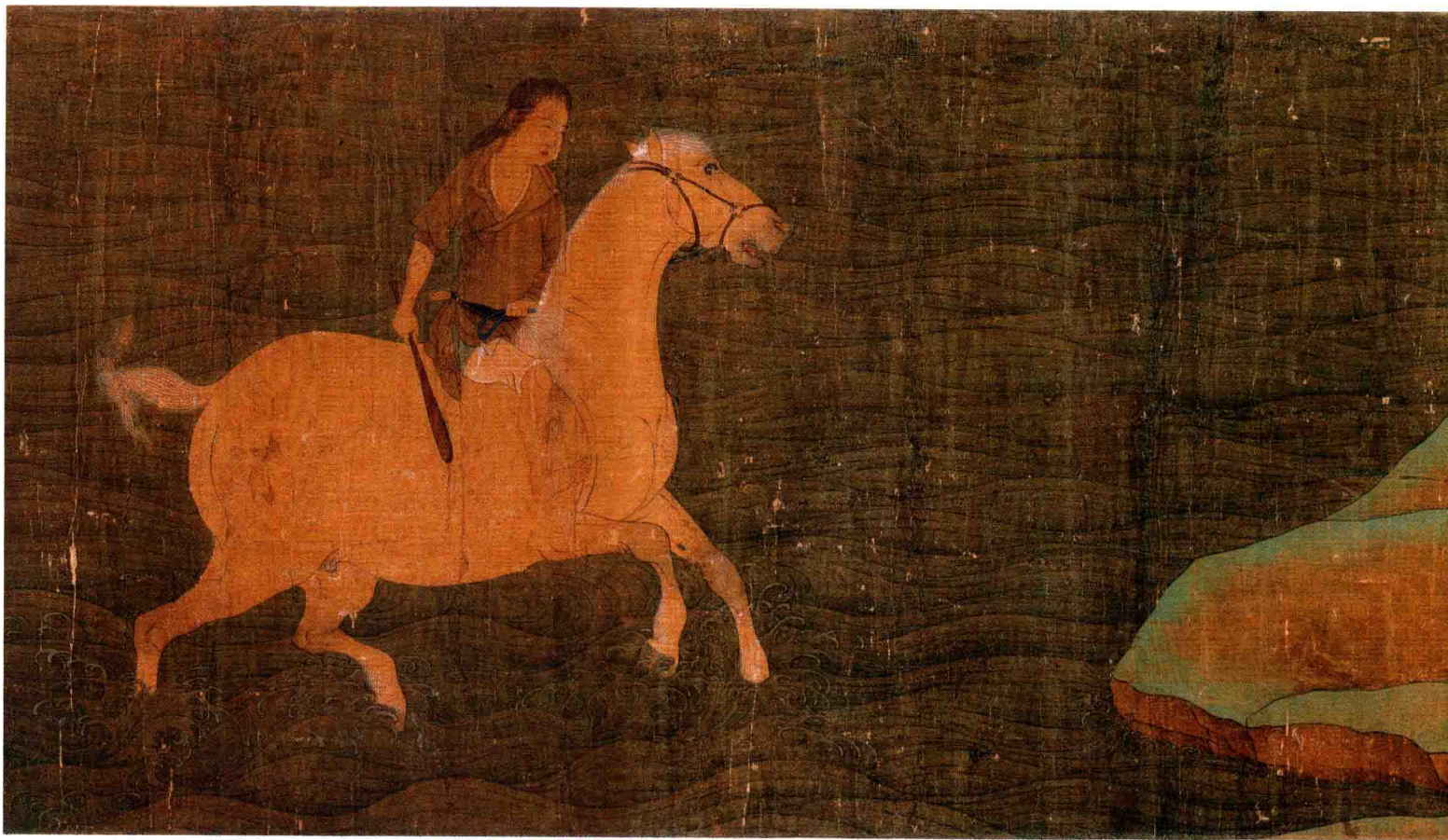
● 韩幹（传）《神骏图》唐代 约1200年前