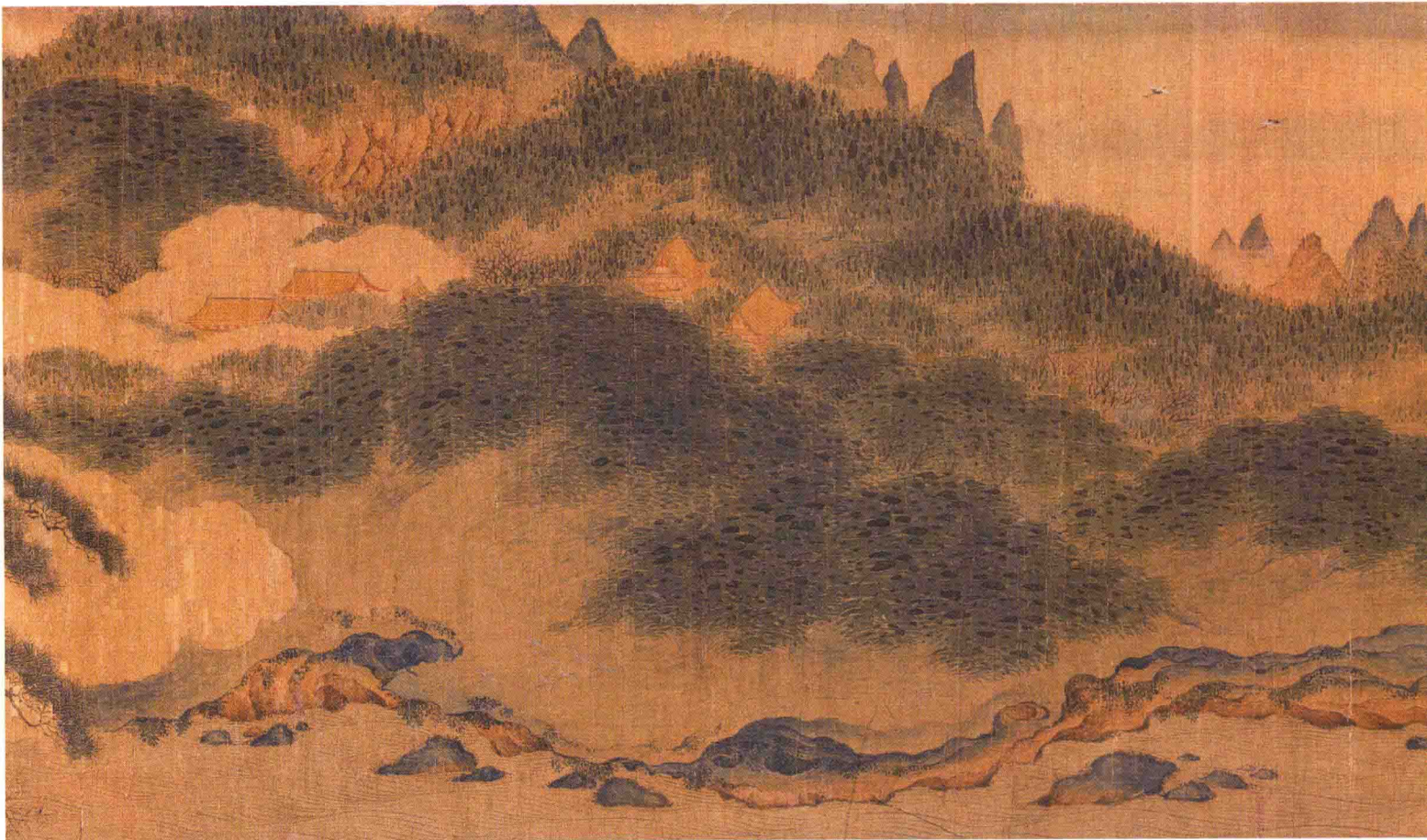
● 赵伯驹 《万松金阙图》局部 南宋 约 830 年前