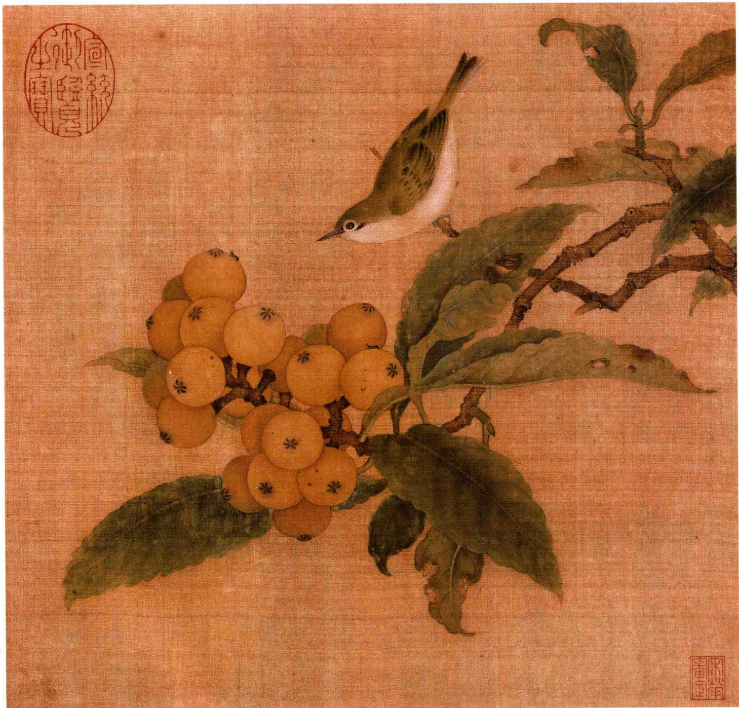
● 林椿《枇杷山鸟图》南宋 约820年前