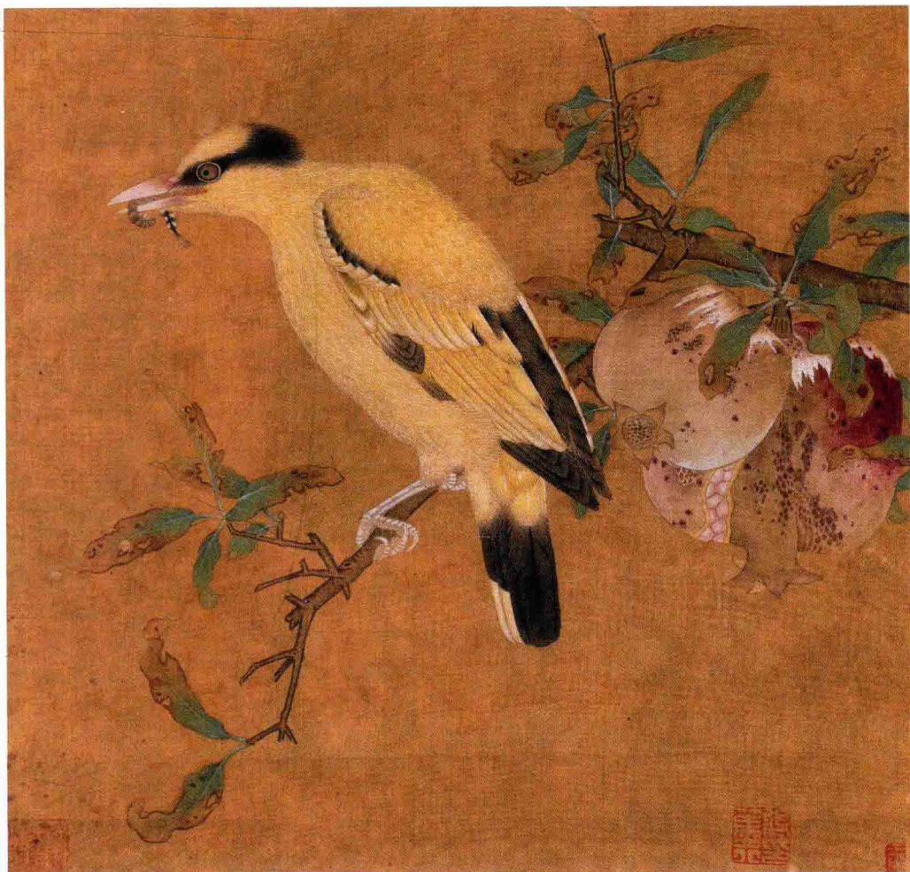
● 毛益（传）《榴枝黄鸟图》南宋 约840年前