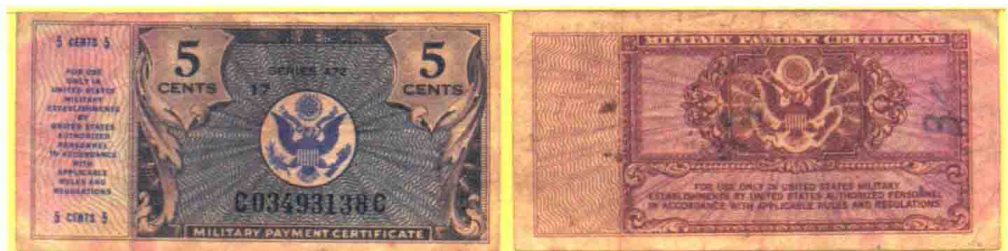
▲ 472系列5美分军用流通券，印刷数量796万张。