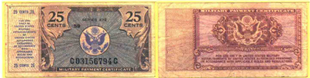
▲ 472系列25美分军用流通券，印刷数量482.4万张。