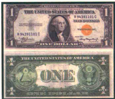
▲ 1935A系列的1美元北非纸币。该种纸币只印刷了14.4万元。流通价值25美元左右，收藏价值150美元左右。