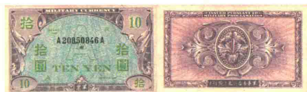
◀ 盟军军事司令部1946年发行的10元A元正背面。