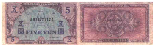
◀ 盟军军事司令部1946年发行的5元A元正背面。