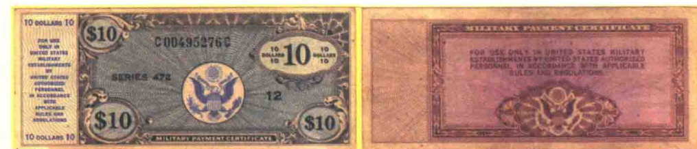
▲ 472系列10美元军用流通券，印刷数量1160万张。