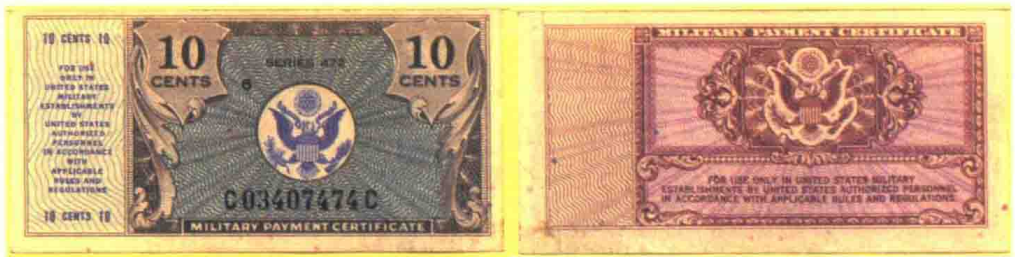
▲ 472系列10美分军用流通券，印刷数量796万张。