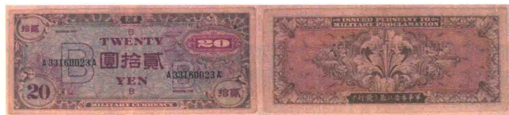
▲ 盟军军事司令部1946年发行的20元A元正背面。