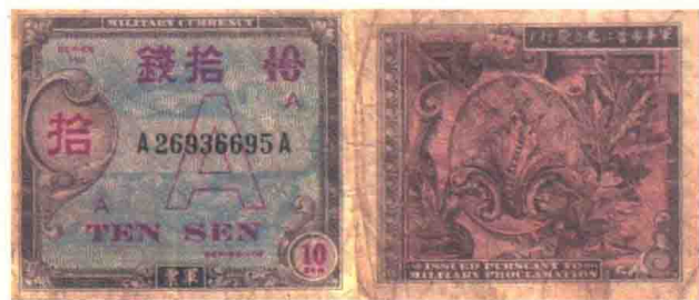
◀ 盟军军事司令部1946年发行的10钱A元正背面。

从1946年至1973年，美国共设计了15个系列的军用流通券，分别是461系列、471系列、472系列、481系列、521系列、541系列、591系列、611系列、641系列、