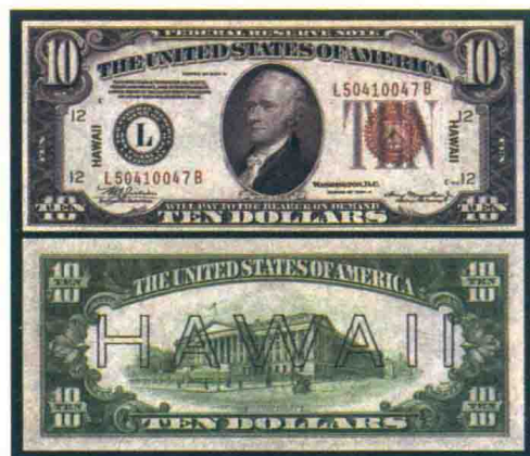
▲套印了“HAWAII”的10美元纸币。