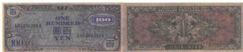
◀ 盟军军事司令部1946年发行的100元A元正背面。