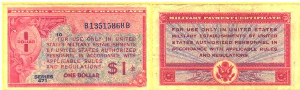
▲ 471系列1美元军用流通券，印刷数量4156万张。