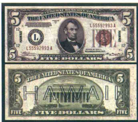
▲套印了“HAWAII”的5美元纸币。