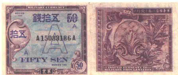
◀ 盟军军事司令部1946年发行的50钱A元正背面。