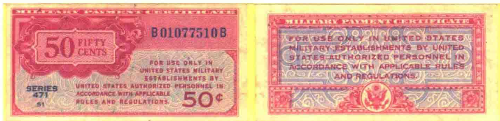
▲ 471系列50美分军用流通券，印刷数量403.2万张。