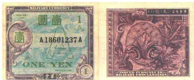
◀ 盟军军事司令部1946年发行的1元A元正背面。