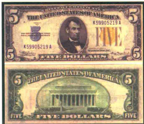
▲ 1934A系列的5美元北非纸币，该种纸币印刷了超过1600万元。