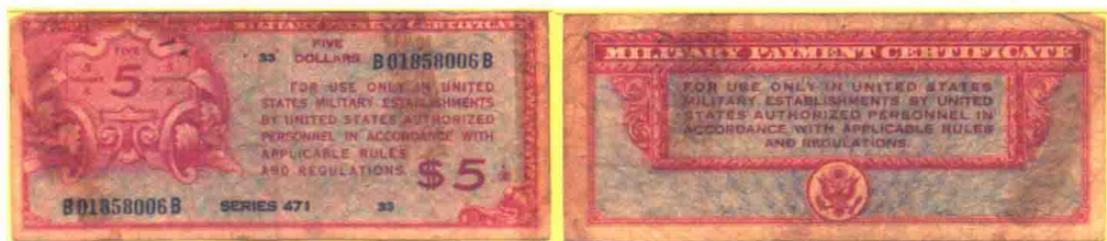
▲ 471系列5美元军用流通券，印刷数量540万张，10美元印刷了1360万张。