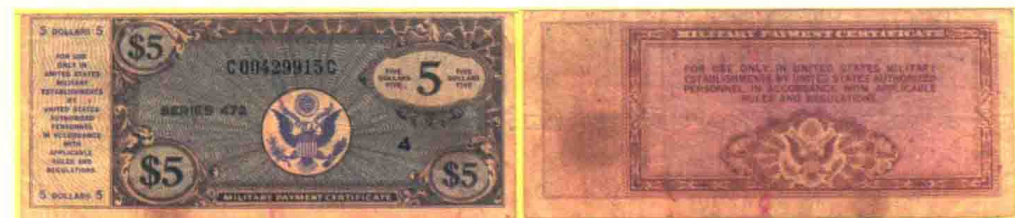
▲ 472系列5美元军用流通券，印刷数量420万张。