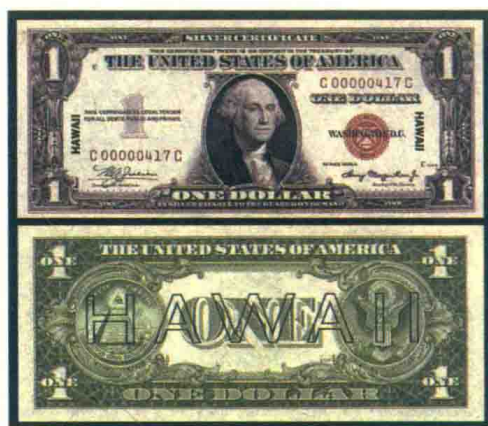
▲套印了“HAWAII”的1美元银圆券。