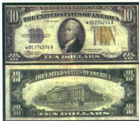
▲ 1934A系列的10美元北非纸币，该种纸币共印刷了2200万元。

的美国军事人员对美元的需求。在欧洲的美军占领地区，居民因不清楚当地政府将来会怎么样而不肯相信本土货币，更喜欢像美元这样稳定的货币，也愿意以非官方汇率接受美元支付。美国军人工资采用美元支付，军人可以无限量地以黑市汇率兑换当地货币，也是危害当地货币市场的因素之一。相比政府规定的汇率，军人们可以从黑市兑换到更多的本土货币。黑市的兑换率并不稳定，越发达的黑市，汇率就越高。这种投机套利的方式在使美元更加利于持有的同时，也加剧了当地的通货膨胀，阻碍了稳定当地经济的计划。