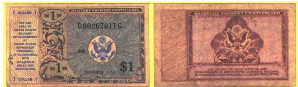
▲ 472系列1美元军用流通券，印刷数量1176万张。