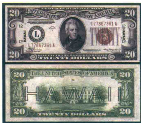
▲套印了“HAWAII”的20美元纸币。