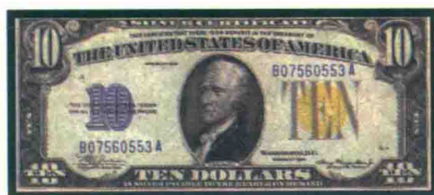
▲ 1934系列的10美元北非纸币。1934系列10美元北非纸币比1934A系列10美元北非纸币要少得多。