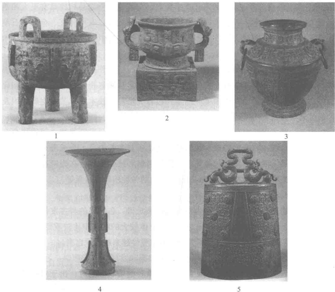
图2 商周时期的青铜礼乐器

3. 礼器和乐器。随着社会的分化和分层，产生了规范人们行为的礼制，而作为礼制载体的礼器应运而生。礼器和乐器产生于史前时期，商周两代达到一个高峰。礼乐器的质料随着时代的变化而有所不同。早期主要为陶器和玉器，进入青铜时代以后，青铜成为制作礼器、乐器和车马器的主要材料（图2），而玉器一直是礼器的重要组成部分。