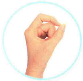
零/〇 líng ዜሮ