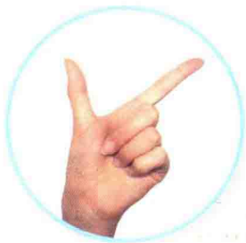
八 bā ሸምንተ