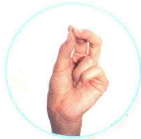
七 qī ሸውዓተ