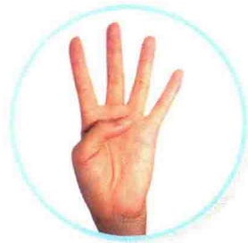
四 sì አርባዕተ