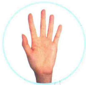
五 wǔ አሙሽተ