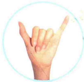
六 liù ሽዱሽተ