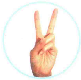
二 èr ከልተ