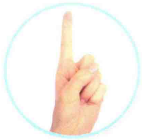
一 yī አደ