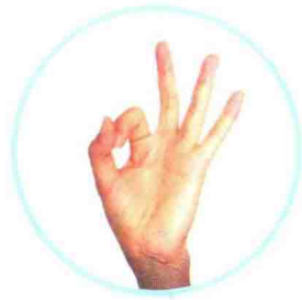
三 sān ሰለስተ