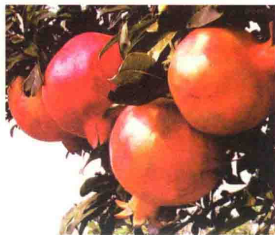
▲ 石榴开花又结果，可以称为华而实

华最早的意思是花。甲骨文的华字，正是一棵开满花的树。金文、篆文的华字，像一朵正在盛开的花儿。华字引申指美丽有光彩的事物，还引申指中华民族或中国，又称华夏。