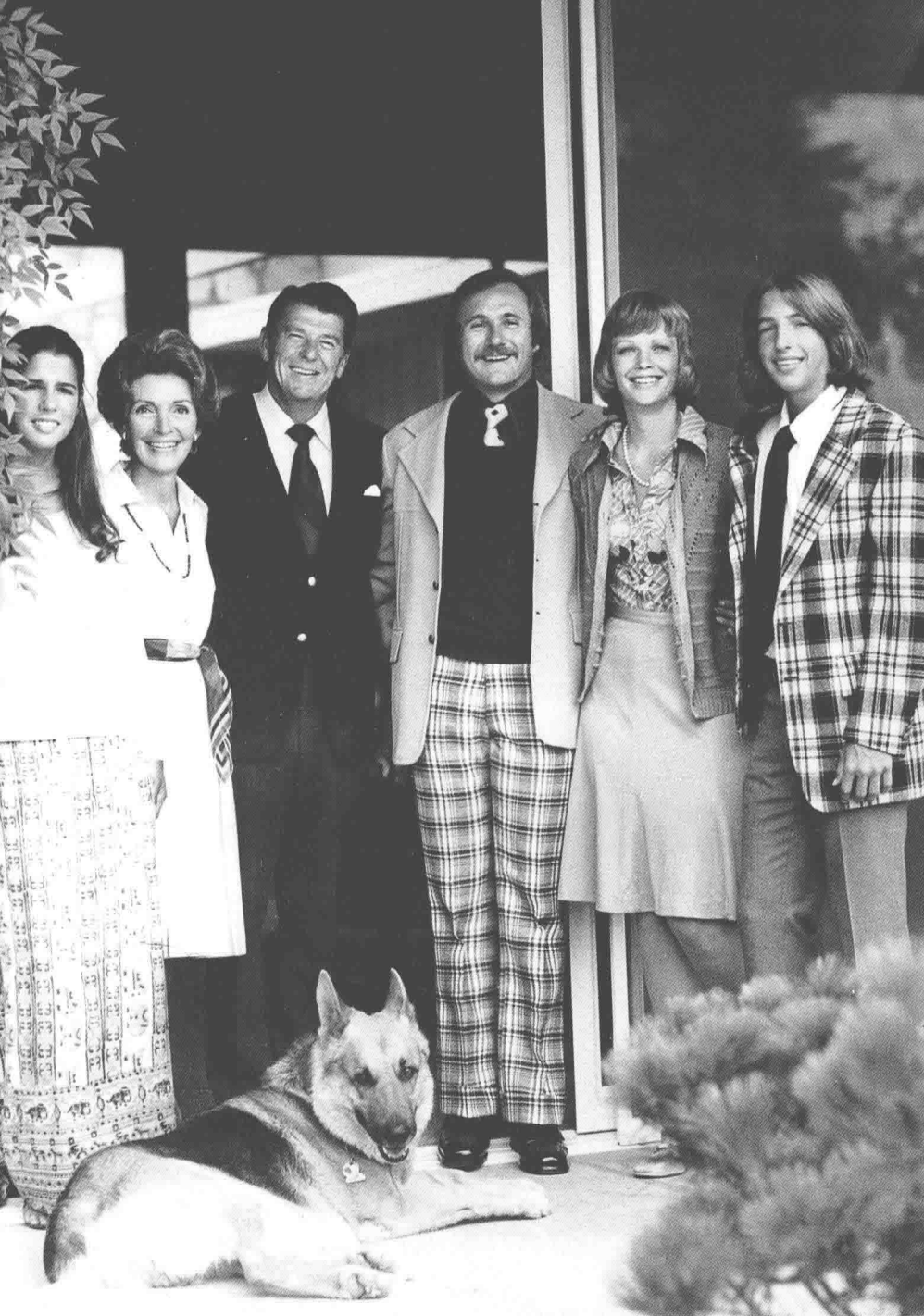
有时，孩子们已经忘却身处父亲的名望中，但他们知道，面对镜头该如何微笑。左起：帕蒂、南希、里根、迈克尔、莫琳、罗恩。