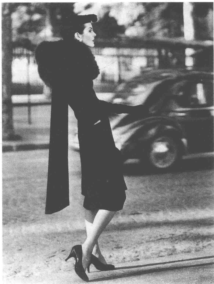
巴黎世家，束腰长上衣，1955 年秋冬系列 (文化学园大学图书馆藏品)