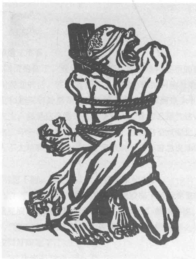
怒吼吧，中国！ 木刻纸本 1935年