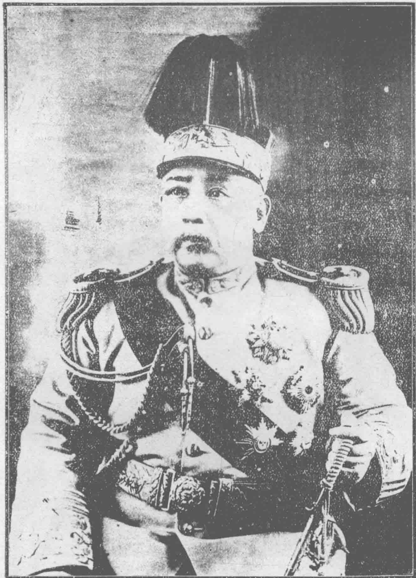
中華民國大總統袁世凱