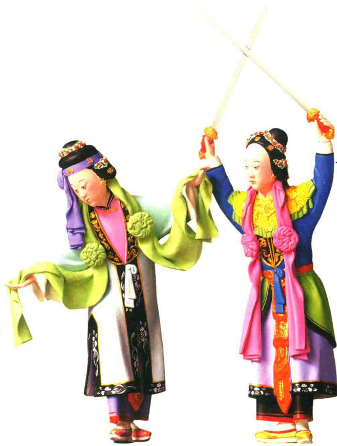
断桥会（吴光让）◎大吴泥彩塑