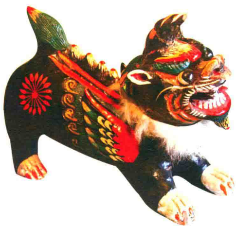
狮面兽（王蓝田）◎浚县泥彩塑