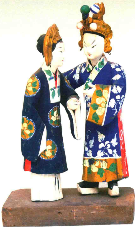
凤仪亭（丁阿金）◎惠山泥彩塑

彩塑，融凝外来艺术日臻创新成熟的隋代彩塑，以细腻完整的手法塑造了雍容丰润的唐代彩塑，还是以写实流畅手法表现人物内心情感、刻画人物性格和形象特征的宋代彩塑，以及求索于生活中人的形态与性格，富于典雅装饰之风的元、明、清彩塑，它们的创作时代与创作条件不尽相同，但所追求的艺术目标是一致的，即造型圆满完整、形态优美生动、色彩纯朴明快。