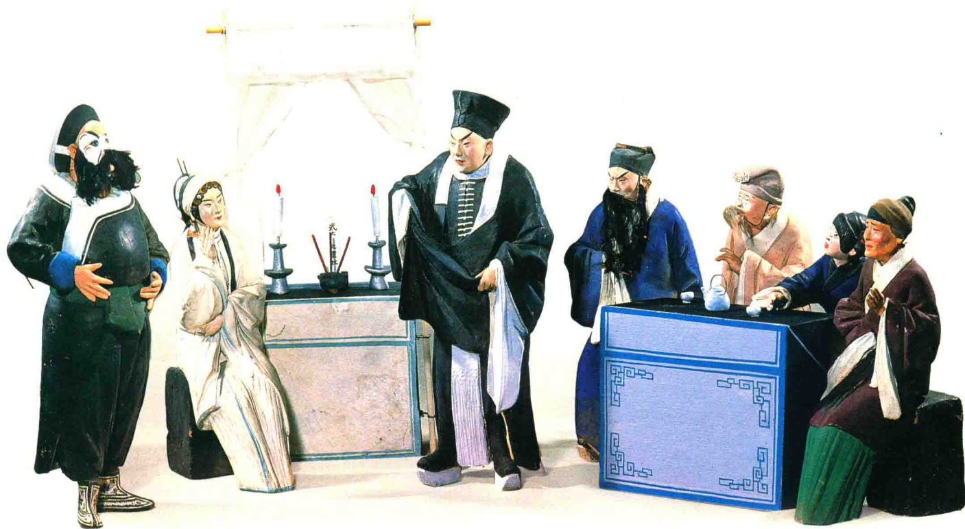
武松省亲（张玉亭）◎“泥人张”彩塑

总之，无论是原始淳厚质朴的彩陶器物，粗犷古拙的男女奴隶俑，已形成飘逸迢然之风的魏晋南北朝