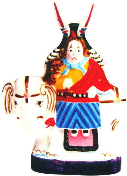
兔爷（双起翔）◎北京泥彩塑