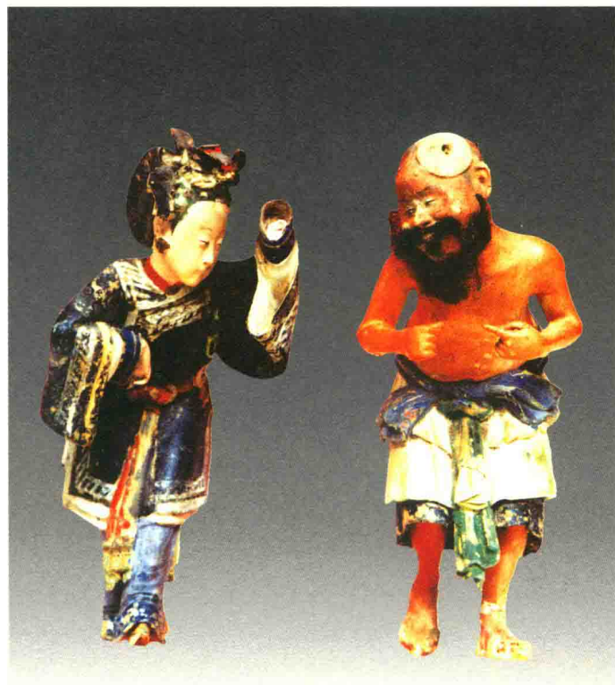
花鼓（吴潘强）◎大吴泥彩塑