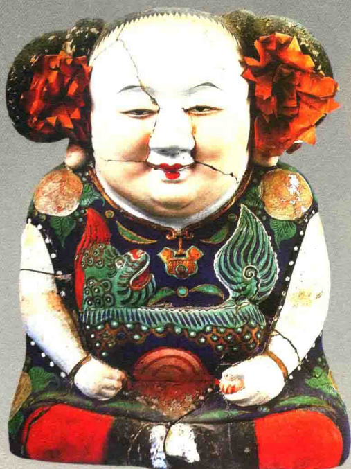
阿福（清代）◎惠山泥彩塑