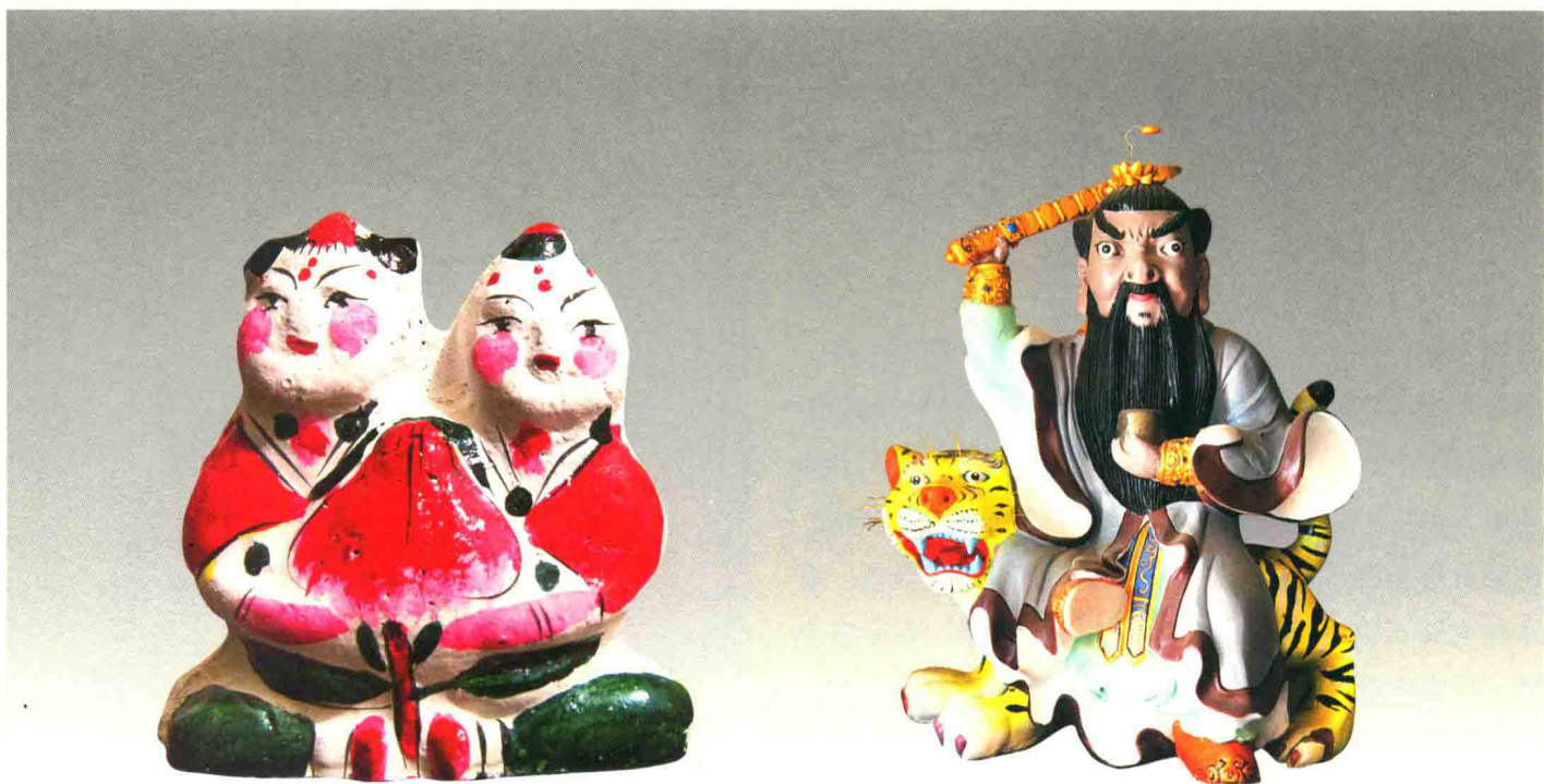
童男童女 ©河北泥彩塑