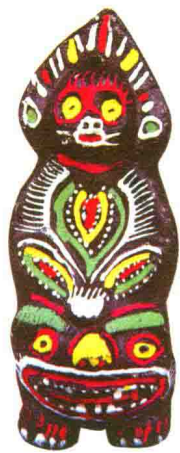
人祖猴（许述齐）◎淮阳泥彩塑