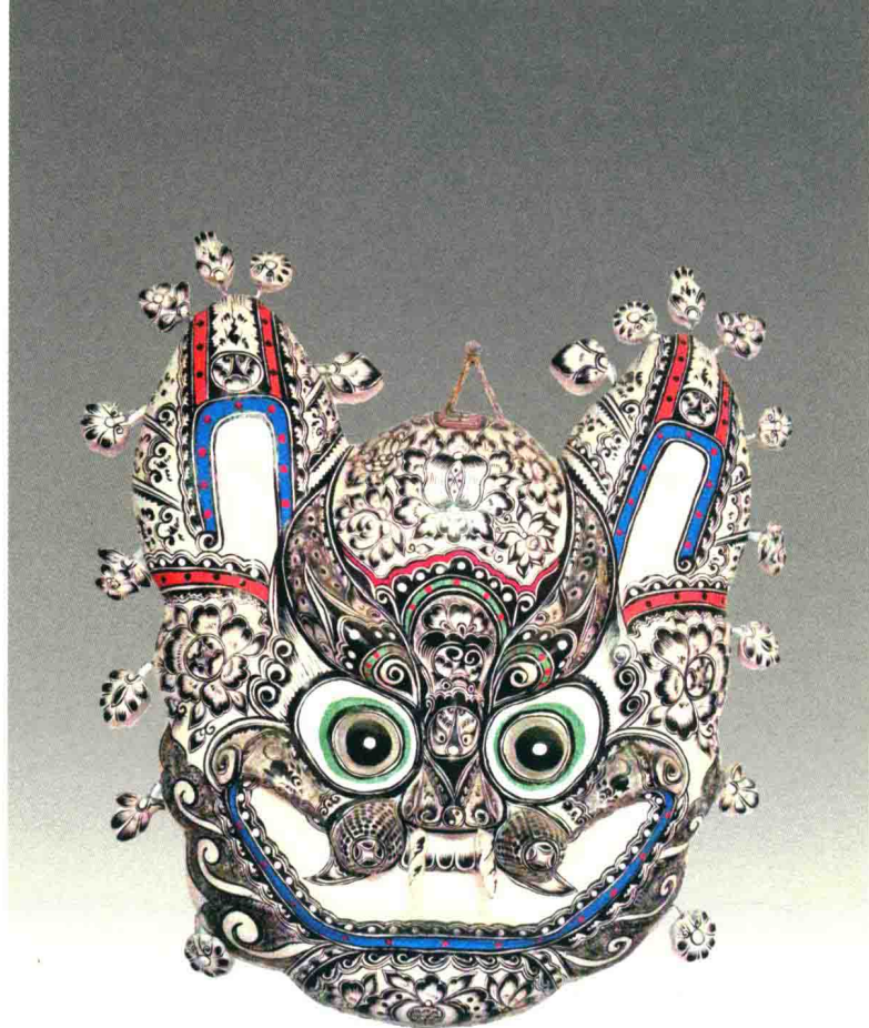
挂虎（胡深）◎凤翔泥彩塑

中国民间泥彩塑植根于中华文化沃土之中，它循系中华文化的优秀文脉，生发繁衍，逐渐形成数量众多、规模宏大、风格迥异的艺术形式。它是世世代代人民群众精神力量的体现，是高度智慧与卓越创作才能的结晶。