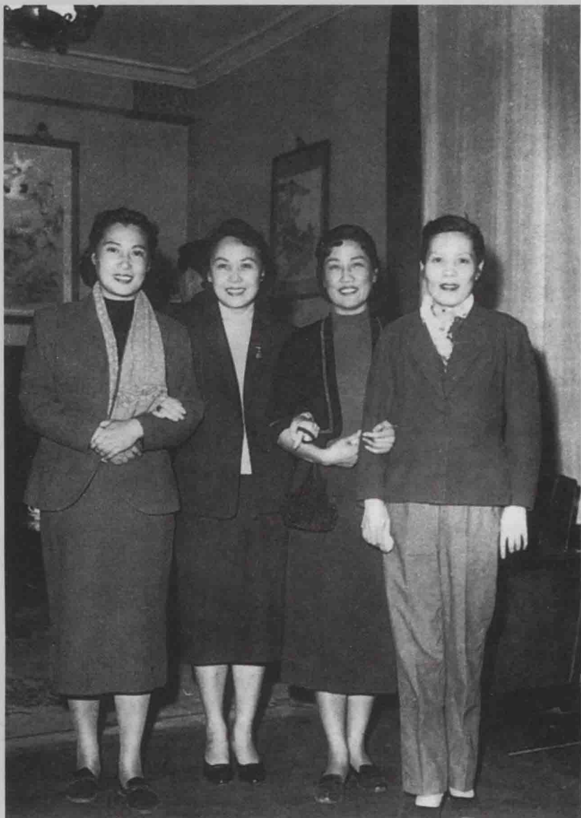
大后方话剧舞台上的“四大名旦”