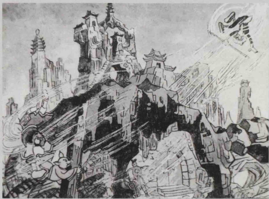
《铁扇公主》剧照：孙悟空驾起筋斗云