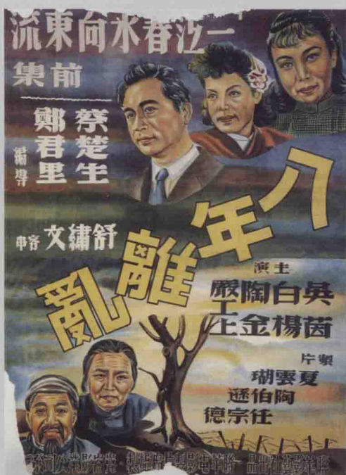
《一江春水向东流》海报