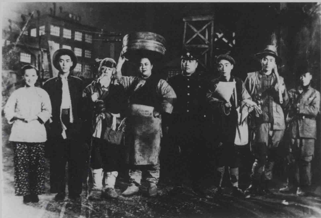
《夜店》剧照：在苦难的底层里生活的人们