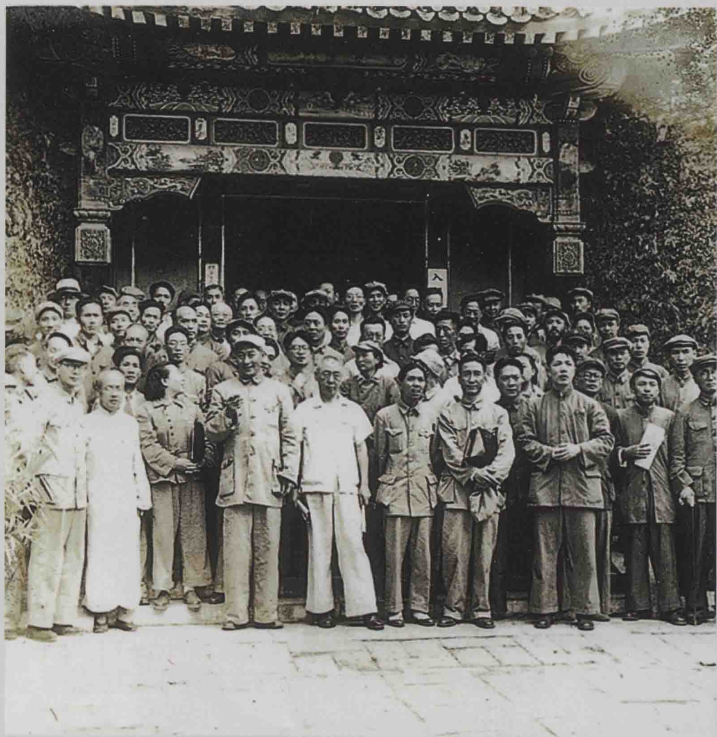
出席中华全国文学艺术工作者代表大会的主席团成员的合影(1949)