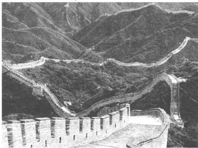
图 1-2 万里长城

修筑防御工程和实行实边固边政策。著名的万里长城是中国古代构筑的以长城城墙为主体，与其他工程设施相结合的连续线式防御工程体系。它是城池筑城体系的发展和运用，历史上先后有8个诸侯国和10多个王朝构筑、修建和连接，到明代形成了东起辽东山海关、西至甘肃嘉峪关，全长5000多千米的长城。长城据险筑墙，关堡相连，烽埃相望，敌台林立，层层布防，在中国战国时期各诸侯国之间、秦统一之后国内各民族之间的战争中，曾发挥过重要的防御作用。