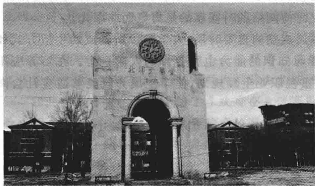
图 1-2 北洋大学堂

而中国大学的起源是北洋大学堂,如图1-2所示,当年中国在甲午海战中惨败日本后,变法之声顿起,天津中西学堂改办为北洋大学堂,标志着中国近代第一所大学诞生。1898年戊戌变法后,京师大学堂成立,这是中国近代的第一所公立大学和综合性大学,如图1-3所示为我国第一张大学毕业证。