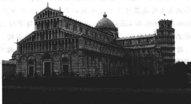
图 1-1 博罗尼亚大学

1088年,意大利建立了第一所正规大学——博罗尼亚大学,如图1-1所示,它是欧洲最著名的罗马法研究中心(其也被称为“母大学”,是一所学生大学)。随后,欧洲各地相继出现了多所大学。巴黎大学是由巴黎圣母院的附属学校演变而来,1200年法国国王承认巴黎大学的学者具有合法的牧师资格,有司法豁免权。