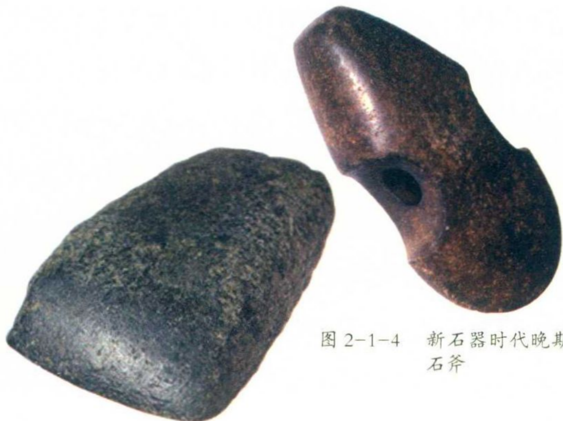
图 2-1-4 新石器时代晚期石斧