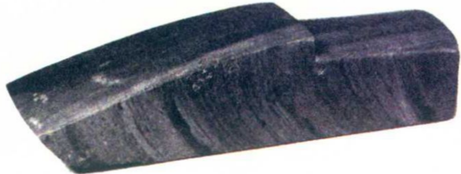
图 2-1-3 新石器时期石斧