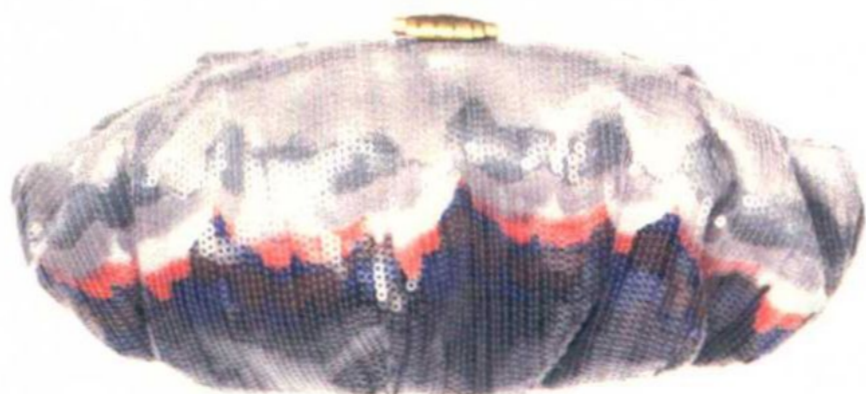
图 2-1-2 “上海滩”品牌扇形手包