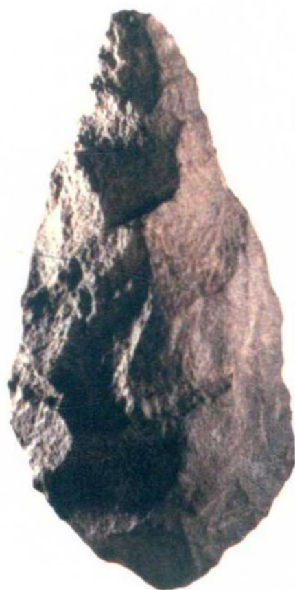
图 2-1-1 双面砍砸器 (大英博物馆藏)

磨光后的新石器（图 2-1-3），形制小巧，造型悦目，手感熨帖。人类祖先在打磨时期时，一定在实用之外，另有执着的审美追求。例如，爱尔兰德力里县新石器时期的一枚石斧，通体黝黑石质坚硬细腻，造型完美，精琢细磨，线条流畅，着力点科学，握感极佳（图 2-1-4）。又如，私人收藏的一枚黑色石斧（图 2-1-5），长 14 厘米、厚 4.5 厘米，打磨精致，棱线方中带圆，刃口规整，令人爱不释手。即使在今天看来，这些石器的平衡感和完成度，也令人惊叹！磨制石器这一行为，应该不只是单纯的制作，它唤醒了人类“做到更好，做得更好看”的意识。石头的“坚实度”与“重量感”，以及“恰到好处的加工适用性”，也使人们产生砍削切断物品的情趣，而它的良好手感又唤醒了人们通过使用道具获得的满足感，引导因直立行走而变得自由的人类开始手工创作。