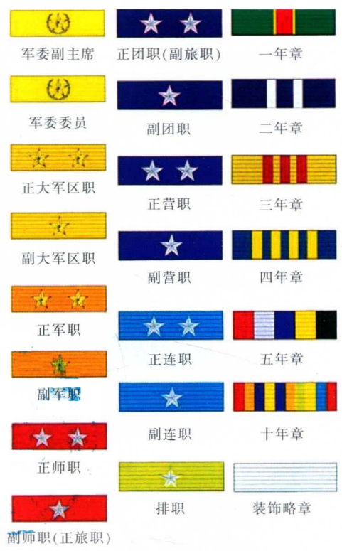
军委副主席 正团职(副旅职) 一年章 军委委员 副团职 二年章 正大军区职 正营职 三年章 副大军区职 副营职 四年章 正军职 正连职 五年章 副军职 副连职 十年章 正师职 排职 装饰略章 副师职(正旅职)