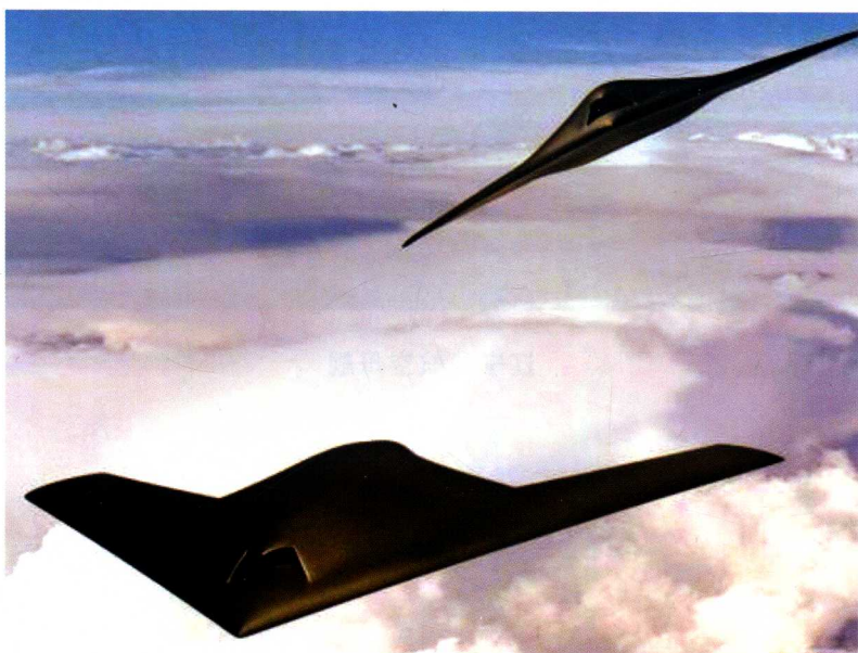
“利剑” 无人隐身战斗机