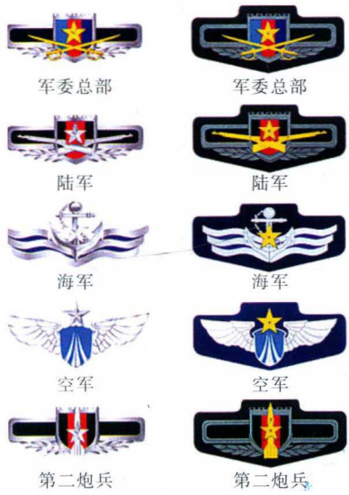
军委总部 陆军 海军 空军 第二炮兵