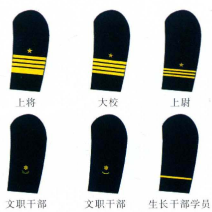
上将 大校 上尉 文职干部 文职干部 生长干部学员