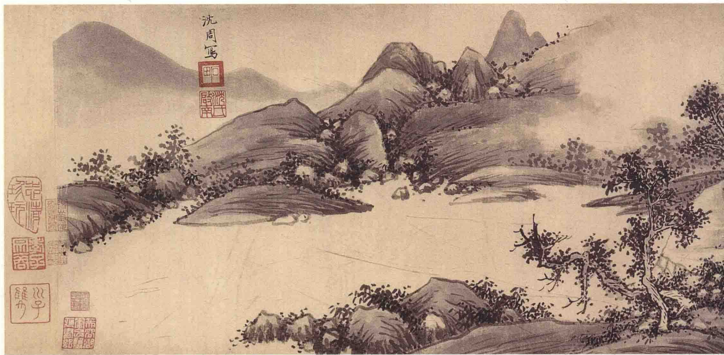
沈周 报德英华图卷 明 纸本墨笔 纵29厘米 横117.6厘米 故宫博物院藏

《报德英华图》卷共计三段：首段题为刘珏作，而其用笔琐碎平庸，系后人仿本；第二段沈周画；第三段为杜琼、沈贞吉合作山水。