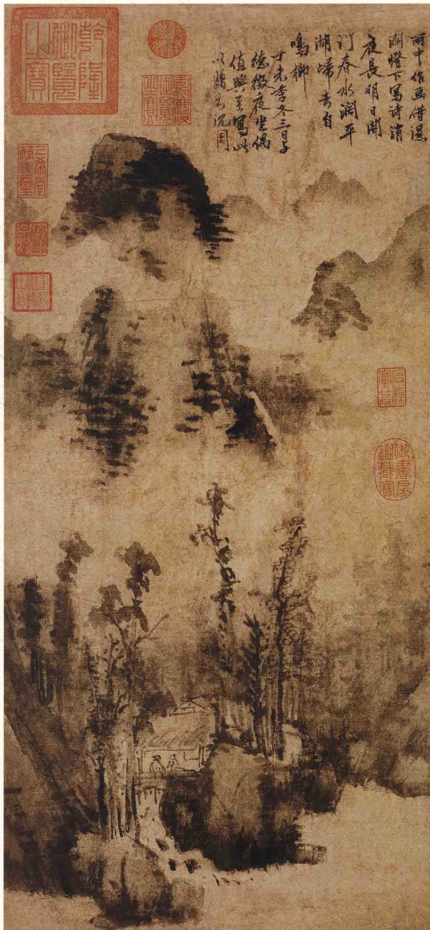
沈周 雨意图轴 明 纸本墨笔 纵67.1厘米 横30.6厘米 台北故宫博物院藏

《雨意图》轴绘群山深谷中陋房一座，窗外云山烟雨，丛林溪流。室内寒宵秉烛，二友相对而谈。此图用笔草草，意境寒幽，苍莽之中别有一种荒寒生动之趣。