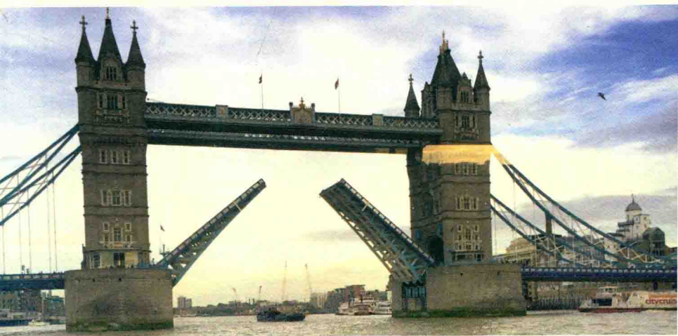
伦敦塔桥 / 伦敦眼上鸟瞰 / 伦敦海德公园