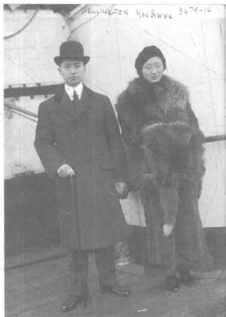
1915年，顾维钧出任美国公使，夫人唐宝玥一同前往