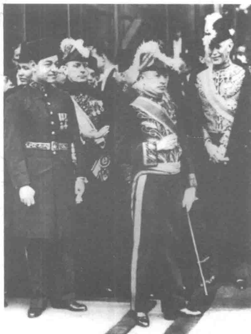
1936年4月，身穿西式宫廷礼服的中国驻法大使顾维钧