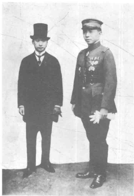
顾维钧与张学良合影