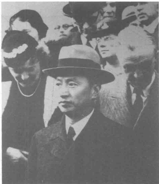
国联大会期间的顾维钧