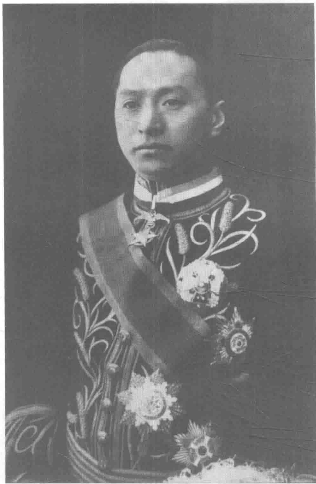
时任北京政府国务总理兼外交总长的顾维钧