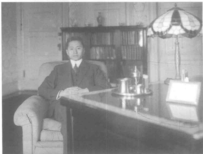
顾维钧在驻美公使馆办公室