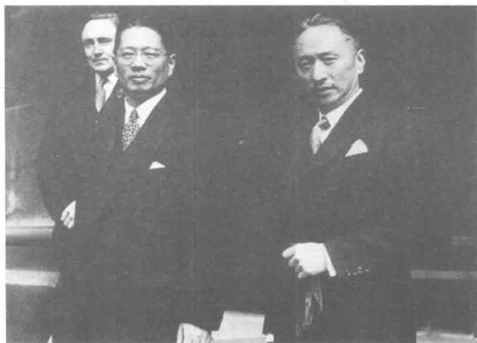
1943年，顾维钧与访问英国的宋子文合影