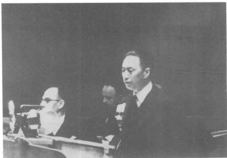
1937年5月15日，顾维钧在国联大会上发言