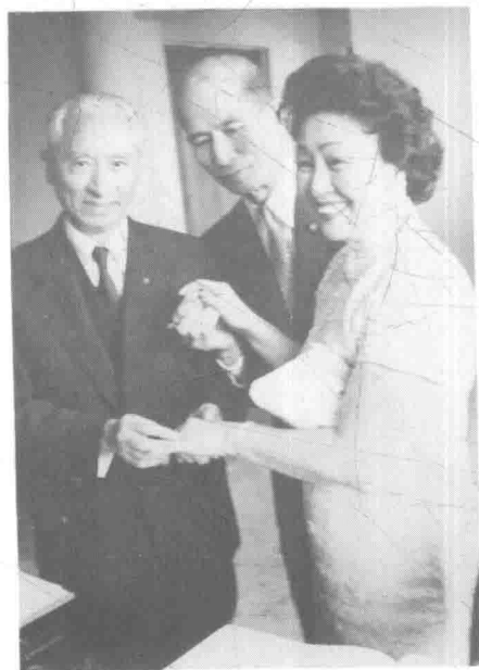
1959年，顾维钧与严幼韵结婚时留影