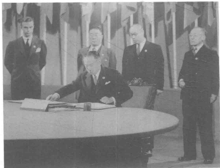
顾维钧第一个在《联合国宪章》上签字