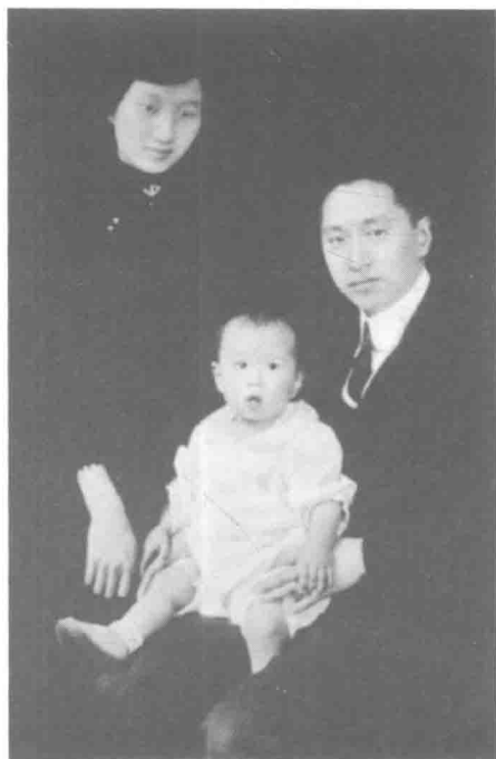
1917年顾维钧、唐宝玥与长子顾德昌合影