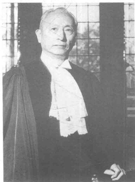
1964年，顾维钧升任国际法院副院长