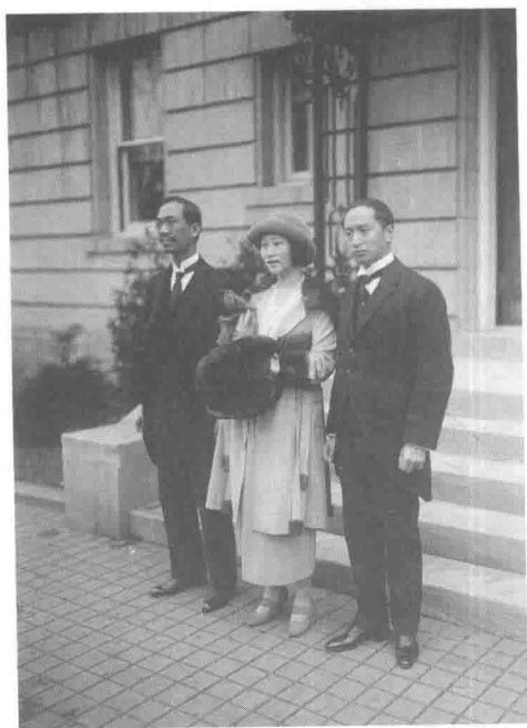
华盛顿会议期间顾维钧（右一）与第三任妻子黄蕙兰及同事合影