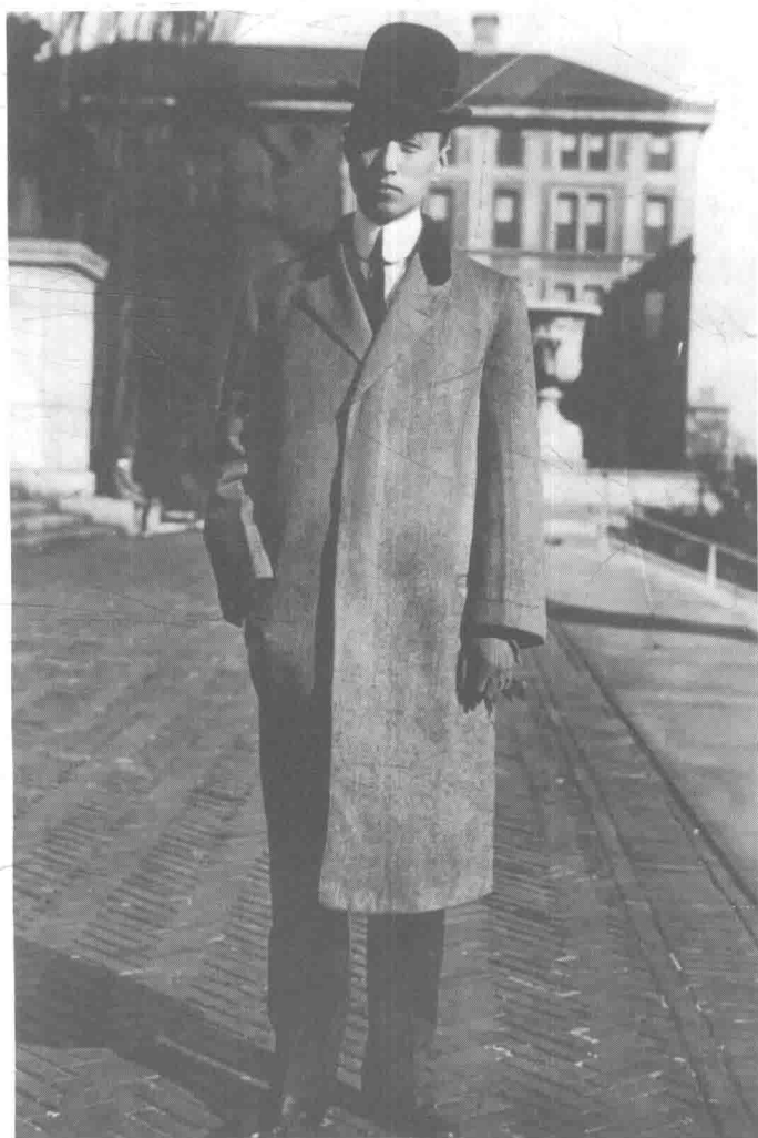
1912年，顾维钧回国担任总统府英文秘书