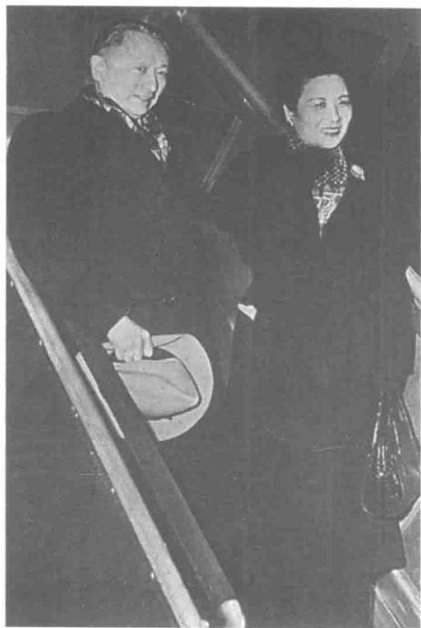
顾维钧与宋美龄合影