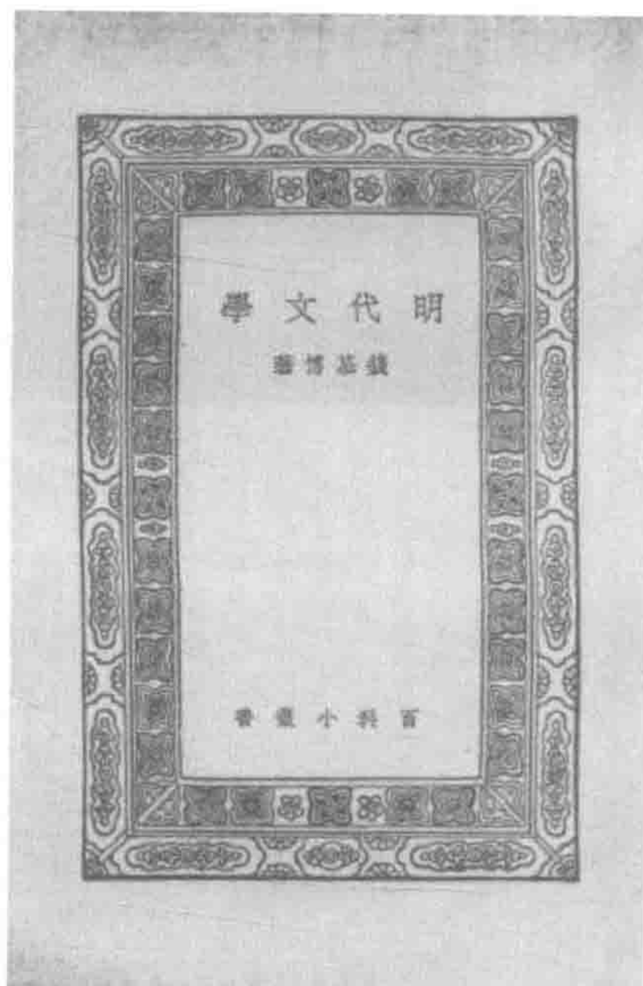
商务印书馆1939年版 《明代文学》扉页