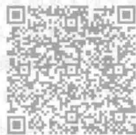
微课 1-1 经济困难学生 国家资助政策