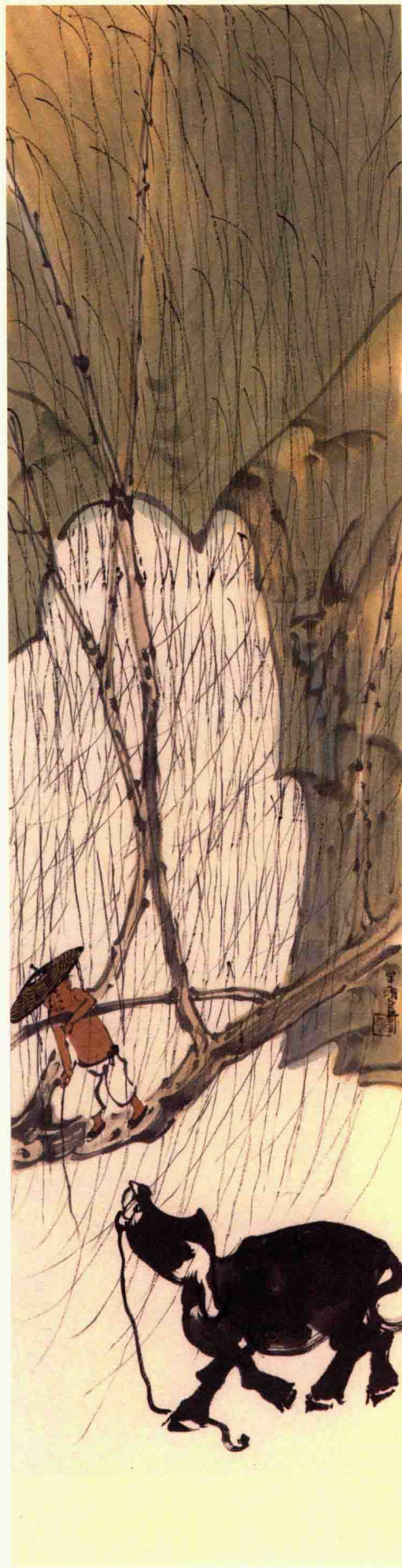
调牧图 136 cm × 34 cm 纸本设色 2010年