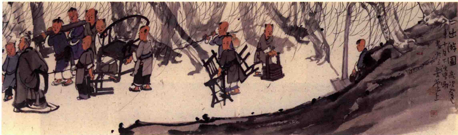
出游图 43 cm×304 cm 纸本设色 2013 年

化妆、布景都浅薄不堪。这种状况，与追逐市场的时风和受众鉴赏力低下不无关系，但最根本的原因，还是画家缺乏必要的文化素养和艺术趣味，缺少对历史和历史人物的敬畏与理解。