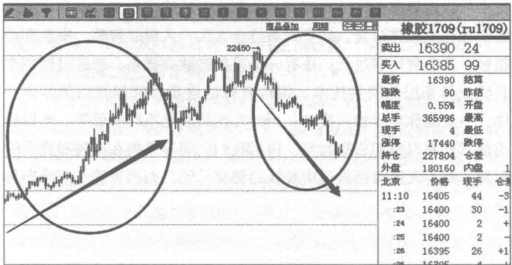
图 1-2 橡胶1709合约半年左右日K线走势